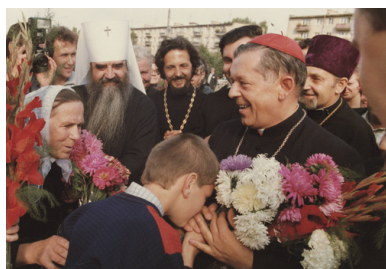
Powitanie prymasa Józefa Glempa przez Polaków w Grodnie, 5 IX 1988 r.; po lewej, w białym kłobuku, metropolita Filaret

Jej znaczenie było wielorakie. Na Białorusi, zwłaszcza w obwodzie grodzieńskim, żyła liczna polska mniejszość narodowa, a miejscowi katolicy nie mieli żadnego biskupa. Prymas przebywał na Białorusi od 5 do 7 września 1988 r. i był m.in. gościem prawosławnego metropolity mińskiego Filareta (Kiryła Wachromiejewa) 16 . Filaret, jako przewodniczący Wydziału Kościelnych Stosunków Zewnętrznych Patriarchatu Moskiewskiego w latach 1981-1989, był partnerem dyplomacji Stolicy Apostolskiej m.in. w sprawach organizacji obchodów Milenium Chrztu Rusi Kijowskiej. Kardynał Glemp rozmawiał z nim już w Moskwie i prawdopodobnie wówczas narodził się plan wyjazdu do Mińska. Prymas odwiedził prawosławne i katolickie świątynie w Grodnie, Lidzie, Nowogródku, Mińsku, Nieświeżu, Pińsku i Brześciu.