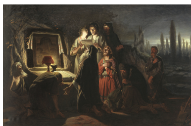
Pierwsi chrześcijanie w Kijowie - obraz Wasilija Pierowa, 1880 r.

Aktywność Józefa Glempa należy postrzegać w kontekście szerszych uwarunkowań związanych z ówczesnymi relacjami między Związkiem Sowieckim a Stolicą Apostolską. Dojście do władzy Michaiła Gorbaczowa i zapoczątkowane przez niego reformy stwarzały możliwości poszerzenia obszaru wolności dla Kościoła w ZSRS. Dlatego aktywność prymasa Polski stała się częścią misji Stolicy Apostolskiej wobec Związku Sowieckiego i krajów Europy Wschodniej 1 .