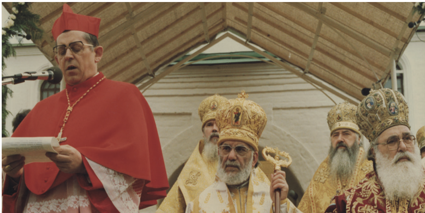
Liturgia centralnej uroczystości Milenium Chrztu Rusi w klasztorze Daniłowskim, Moskwa, 12 VI 1988 r.; pierwszy z prawej metropolita miński Filaret, wiceprzewodniczący synodalnej komisji przygotowującej obchody

https://przystanekhistoria.pl/pa2/tematy/kosciol/89194,Historyczna-misja-prymasa-Glempa.html