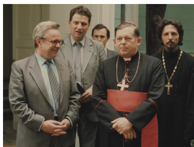
Spotkanie kard. Józefa Glempa z

W trakcie rozmowy Jaruzelski zwrócił uwagę arcybiskupa na procesy rozgrywające się w Związku Sowieckim. Jak mówił, dzieją się tam rzeczy wielkie i powinny zostać zauważone przez Kościół, gdyż będzie to miało wpływ na przyszłość świata. W tym kontekście zwrócił uwagę na wywiad prymasa. Jak podkreślił, do rozmowy doszło za zgodą czynników państwowych obu krajów. Silvestrini nie podzielał tego optymizmu. Mówił, że relacje sowiecko-watykańskie są na razie w fazie wstępnej; użył nawet sformułowania, że znajdują się w przedpokojach. Moskwa nie odpowiedziała na pozytywne gesty papieża, m.in. wysłanie przedstawiciela na rozmowy o zmianach w prawie wyznaniowym. Nierozwiązane – tłumaczy dalej arcybiskup – są problemy Kościoła na Litwie i Białorusi, w ogóle nie udało się poruszyć legalizacji Kościoła greckokatolickiego, a bez tego wszelkie deklaracje będą bez pokrycia. Dodał jednak, że Watykan z uwagą obserwuje reformy Gorbaczowa i ma nadzieję, że doprowadzą one do rzeczywistej zmiany w położeniu ludzi wierzących 5 .