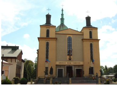
Kościół Chrystusa Króla w Rzeszowie

W listopadzie 1980 r. w trakcie uroczystości poświęcenia dzwonów w Zwiężycy mówił (cytat w oparciu o meldunek SB):