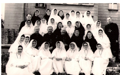
Siostry Świętej Rodziny z Bordeaux

W latach pięćdziesiątych na terenie Łodzi dochodziło do usuwania osób zakonnych - w szczególności dotyczyło to sióstr zakonnych - z terenów szpitali, w których mieszkały one oraz pracowały. Do sytuacji takiej doszło w pierwszym kwartale 1953 r., kiedy to Referat ds. Wyznań PRN m. Łodzi zlikwidował dom Zgromadzenia SS. Niepokalanego Poczęcia NMP, który mieścił się przy szpitalu im. Barlickiego. W wyniku tego siostry przeniosły się do domu generalnego w Szymanowie. Zdarzały się również przypadki, iż jedne siostry były usuwane z terenu Łodzi i województwa łódzkiego, zaś inne przybywały na ten teren. Wraz z wydalaniem SS. Niepokalanek w pierwszym kwartale 1953 r. na terenie Łodzi osiadły SS. Albertynki z Krakowa, które zostały zatrudnione w Państwowym Zakładzie dla Nieuleczalnie Chorych.