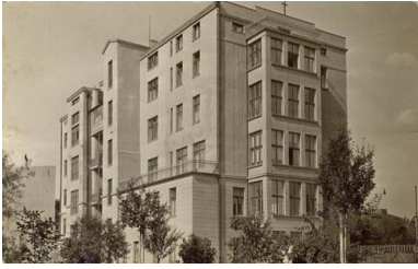
Szpital św. Rodziny ok. 1961 r.