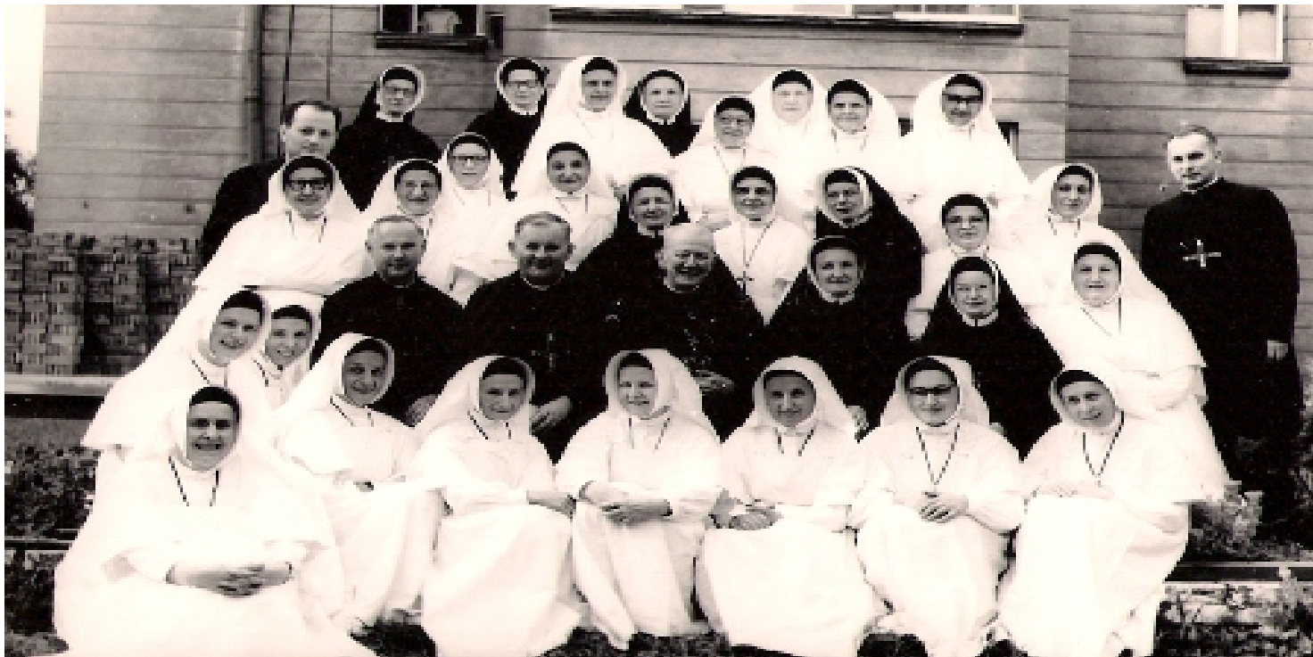
Siostry Świętej Rodziny z Bordeaux

https://przystanekhistoria.pl/pa2/tematy/kosciol/90191,Laicyzacja-zycia-spoiecznego-w-peerelowskiej-Lodzi-casus-szpitala-Siostr-Swietej.html