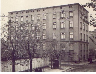
Szpital św. Rodziny w 1961 r.