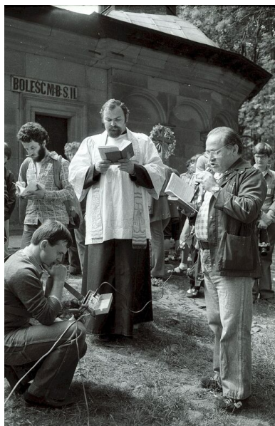
Nabożeństwo Konfraterni Robotniczej z Mistrzejowic na Drózkach Matki Bożej w Kalwarii Zebrzydowskiej, 26 maja 1984 r.

Na początku 1989 r., w okresie przemian politycznych, kapłan uznał, że jego misja w Mistrzejowicach dobiegła końca i powinien podjąć nowe zadania. Zgodnie z prośbą został przeniesiony na wakujące stanowisko proboszcza w Luborzycy.