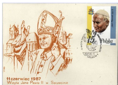
Karta pocztowa upamiętniająca trzecią pielgrzymkę papieża Jana Pawła II do ziemi polskiej, w tym wizytę w Szczecinie.