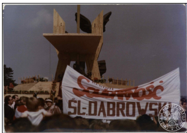
Wierni zgromadzeni na papieskiej Mszy św. na Jasnych Błoniach w Szczecinie, 11 czerwca 1987 r.

Wizyta Jana Pawła II w Szczecinie miała miejsce 11 czerwca 1987 r. Główna celebra odbyła się na Jasnych Błoniach. Następnie papież wmurował kamień węgielny pod budujące się seminarium duchowne i przemówił do duchowieństwa w szczecińskiej katedrze. Podsumowując tę wizytę władze odnotowały, że tego dnia do Szczecina przyjechało około 690 autobusów, uruchomionych zostało 13 pociągów specjalnych, kursujących na trasach lokalnych i 15 dalekobieżnych. Do Szczecina zjechało również 10 tys. samochodów prywatnych, a ogólną liczbę pielgrzymów przybyłych do miasta szacuje się na około 110 tys.