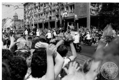
Jan Paweł II przejeżdża ulicami Szczecina pozdrawiany przez wiernych, 11 czerwca 1987 r.