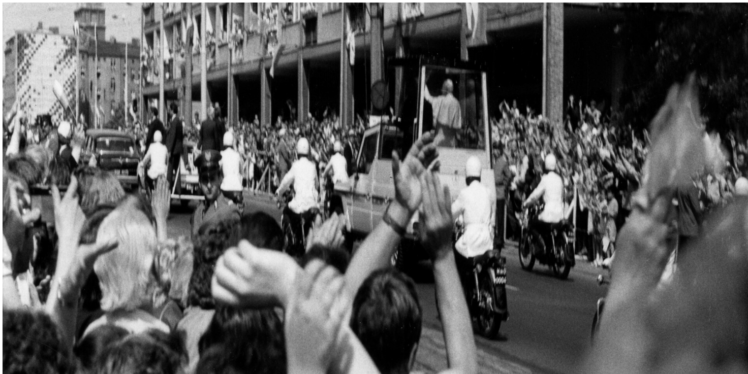
Fot. z zasobu IPN (dar prywatny Małgorzaty Kuwik)

https://przystanekhistoria.pl/pa2/tematy/kosciol/91969,Dzieje-Kosciola-katolickiego-na-Pomorzu-Zachodnim-Relacje-panstwo-Kosciol-w-lata.html