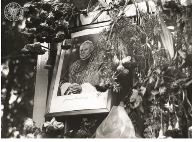
Portret papieża Jana Pawła II na bramie Stoczni Gdańskiej podczas strajku w sierpniu 1980 r.