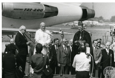
Powitanie Jana Pawła II na lotnisku w Warszawie, 2 czerwca 1979 r. Na lewo od papieża stoi kard. Stefan Wyszyński.