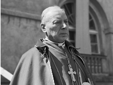
Prymas Stefan Wyszyński

kurii krakowskiej, wydanie w lutym 1953 r. przez Radę Państwa dekretu o obsadzaniu stanowisk kościelnych (dawał władzom prawo decydowania o obsadzaniu i usuwaniu ze wszystkich stanowisk kościelnych) oraz uwięzienie prymasa Stefana Wyszyńskiego we wrześniu 1953 r. – to wydarzenia, które najlepiej ukazują komunistyczny plan generalnej rozprawy z Kościołem katolickim w Polsce.