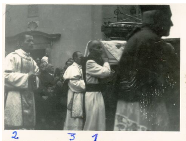
Fotografia inwigilowanych zakonników, kościół Ojców Cystersów w Jędrzejowie, 1961 r.

udało się także zniszczyć wewnętrzną autonomię Kościoła katolickiego. Aresztowania i procesy sądowe przestały być powszechnym narzędziem represji, a powrót w następnych latach do stalinowskich metod okazał się niemożliwy.