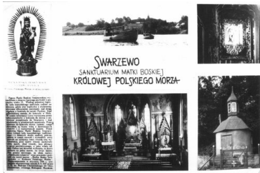
Pamiętka sanktuarium w Swarzewie w formie fotokopii.

lata za zgodą władz do sanktuarium przybywały pielgrzymki z kilkunastu gdańskich parafii. Później jednak, pomimo starań proboszcza i gdańskich biskupów, wykazujących przedwojenne znaczenie tych pielgrzymek, zostały one zakazane, a podstawą wydawania negatywnych decyzji było twierdzenie o braku ich tradycyjności. Kolejna „legalna” pielgrzymka do Świętego Wojciecha odbyła się dopiero w 1990 roku. Do tego czasu wierni chodzili w sposób formalnie niezorganizowany.