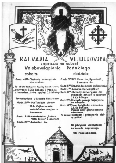
Zaproszenie z programem odpustu Wniebowstąpienia Pańskiego na Kalwarii Wejherowskiej 28-29 maja 1960 r.