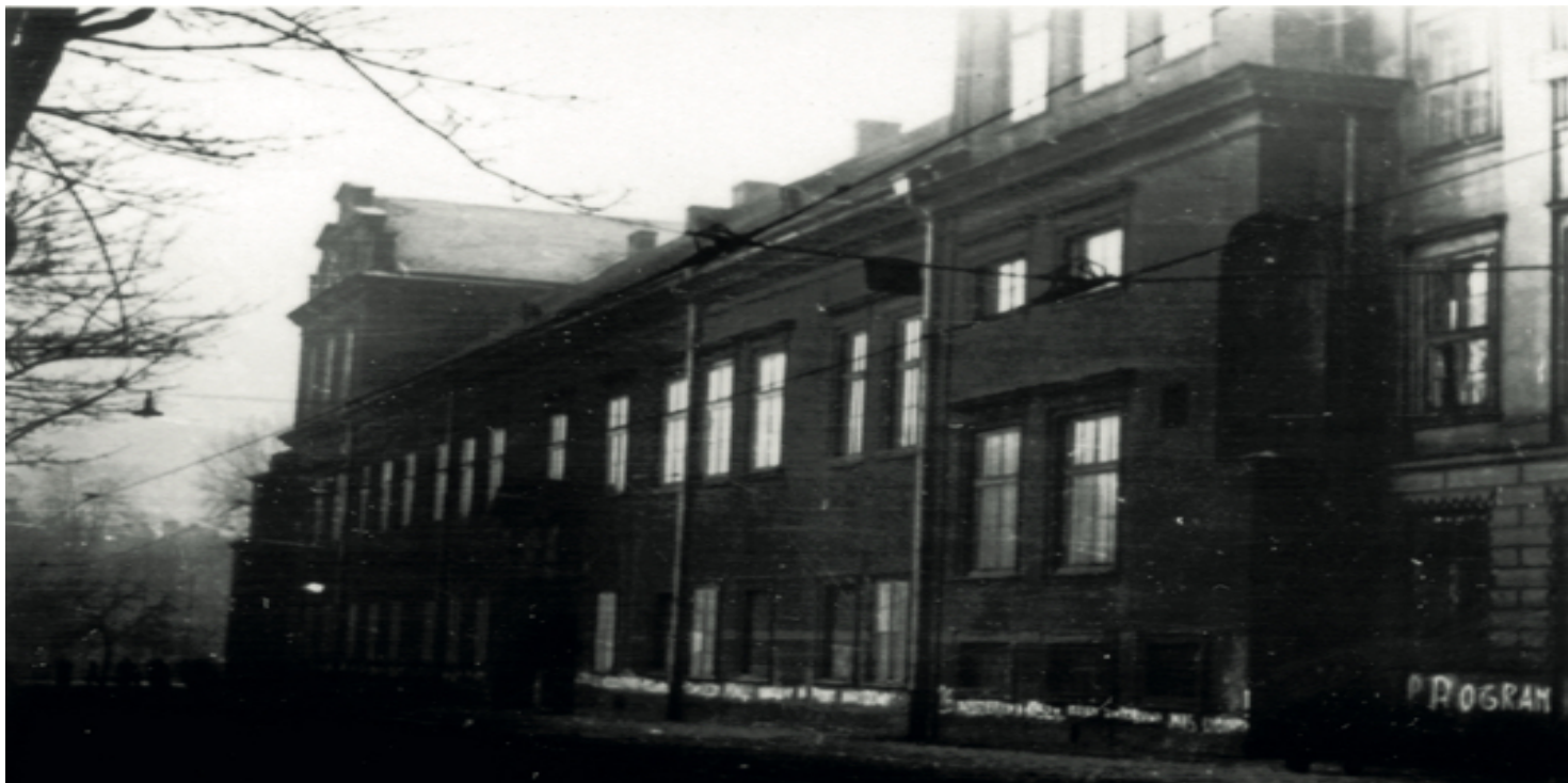
Siedziba kurii krakowskiej; zdjęcie wykonane przez UB (fot. z zasobu IPN)

https://przystanekhistoria.pl/pa2/tematy/kosciol/99150,Proces-kurii-krakowskiej-Komunisci-w-walce-z-Kosciolem.html