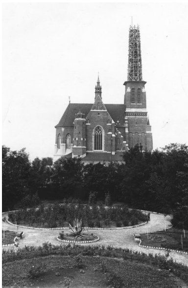
Polska, woj. wołyńskie, Kowel. Kościół Pomnik Krwi i Chwały św. Stanisława Biskupa Męczennika (przełom lat 20. i 30. XX w.; podczas budowy).

Przełożeni skierowali go na probostwo w Grodzisku Mazowieckim, a następnie w Nowym Dworze koło Warszawy. Wreszcie w maju 1930 r. przeniesiono go na Wołyń. Wykładał w Seminarium Duchownym w Łucku, a w 1931 r. został proboszczem w Kowlu. Wówczas właśnie powstała praca Przyczynek do historii męczeństwa Kościoła rzymsko-katolickiego w diecezjach kamienieckiej i łucko-żytomirskiej (1863-1930) . Dzięki jego staraniom dokończono w Kowlu budowę świątyni Pomnik Krwi i Chwały św. Stanisława Biskupa Męczennika. Dziś kościół ten już nie istnieje, bo został rozebrany po II wojnie światowej.