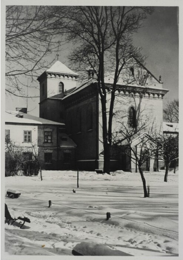
Polska, Lwów, kościół św. Łazarza. Poczтівka z 1939.