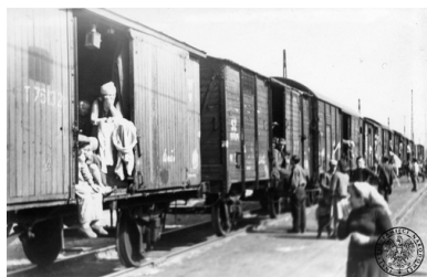
Pociąg z przesiedlonymi ze Wschodu na jednej ze stacji na terenie Śląska, 1945-1946 r.

Ci, którzy nie chcieli jechać dalej, nalegali, by pozwolono im pozostać w górnośląskich miastach. Tymczasem już w połowie 1945 r. chłonność osadnicza Bytomia, Gliwic czy Zabrze się wyczerpała. Żeby przyjąć nowych mieszkańców, trzeba było przyspieszyć akcję wysiedlania Niemców, czego nie chciano przeprowadzić bez czasochłonnej weryfikacji narodowościowej. Miasta dosłownie pękały w szwach. Tym bardziej że oprócz akcji osadniczej prowadzonej przez PUR nagminne były przypadki osiedlania się „na własną rękę”. Opuszczano transporty, wiedząc, że wcześniej znaleźli w tych miastach mieszkania krewni czy znajomi. Wprowadzano się do nich albo samowolnie zajmowano puste lokale i dopiero wtedy podejmowano w Oddziale PUR lub w urzędzie mieszkaniowym działania na rzecz zalegalizowania pobytu.