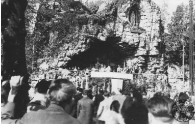
Wierni zebrani przy Grocie Lurdzkiej na Górze św. Anny podczas uroczystości dożynkowej.

Kościół odegrał jednak ważną rolę integracyjną. Księża zachęcali do udziału w tradycyjnych świątach i uroczystościach religijnych. Kiedy w maju 1946 r. zbliżały się doroczne uroczystości na Górze św. Anny, w parafiach deklaracje uczestnictwa zgłosiła również spora część dawnych mieszkańców Kresów. Komentarz sprawozdawcy Zachodniej Agencji Prasowej, który uznał to za dowód