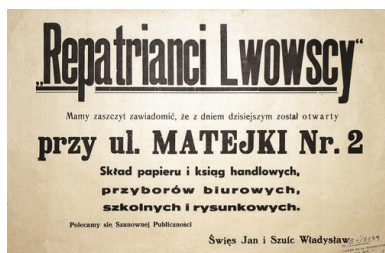
Afisz reklamowy składu papierów i artykułów biurowych oraz szkolnych w Gliwicach należącego do Polaków ze Lwowa, 1946 r.

Adaptacja wysiedlonych z Kresów w nowym miejscu zamieszkania przebiegała z trudem. Różnice językowe, odrębność kulturowa, przekonanie o niesprawiedliwości przesiedlenia, poczucie tymczasowości – wszystko to z pewnością nie ułatwiało życia w nowym otoczeniu. Brak zrozumienia, wzajemne niechęci i urazy generowały konflikty między ludnością miejscową a nowymi mieszkańcami. Odmienność kulturowa regionu zdecydowanie niekorzystnie oddziaływała na przybyszów. Oczywiście nie należy uogólniać, zdarzały się bowiem wyjątki. Wbrew oficjalnej, antyniemieckiej propagandzie, różnice narodowościowe, kulturowe i językowe nie zawsze uniemożliwiały dobrosąsiedzkie współżycie, które w wielu przypadkach kończyło się przyjaźniami, a nawet mieszanymi małżeństwami.