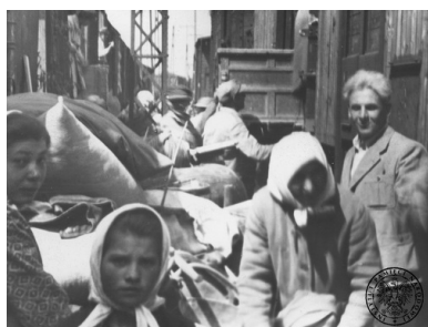
Przesiedleni zza Buga na jednej ze stacji kolejowych, 1945-1946 r.

wówczas na wizytację opolskiej części Górnego Śląska, pisał, że na trasie kolejowej Opole – Wrocław spotkał całe skupiska przesiedlonych rozłożone po obu stronach torowisk: „rodziny te od trzech tygodni i więcej pozbawione środków żywnościowych, opieki sanitarnej, łudzone obietnicami wyjazdu już »jutro lub za parę dni«, pozostają w warunkach urągających najprymitywniejszym pojęciom bytowania ludzkiego”. Pod koniec 1945 r. sytuację na terenie katowickiej Dyrekcji Okręgowej Kolei Państwowych określano jako katastrofalną. Brak wagonów krytych próbowano uzupełniać, organizując transporty w wagonach otwartych, tzw. węglarkach. Tymczasem jeszcze w sierpniu 1945 r. kierownik punktu etapowego PUR w Katowicach-Ligocie pisał do swoich przełożonych, że na stacji stoi, od przeszło dwóch miesięcy, 120 wagonów załadowanych sowieckimi zdobyczami wojennymi. Sytuację pogarszało obciążenie głównych linii kolejowych przez wojsko sowieckie, którego przewóz traktowano jako priorytetowy.