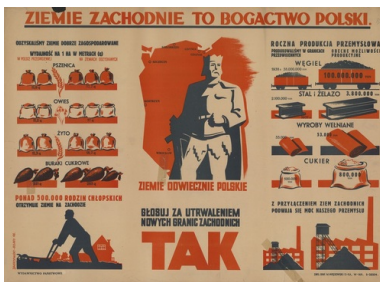
Plakat propagandowy z kampanii referendalnej w 1946 r.

Pierwsi Kresowianie dotarli na Górny Śląsk już w lutym 1945 r., niebawem po ukonstytuowaniu się polskich władz w Katowicach i niedługo po tym, jak w wyniku operacji sandomiersko-śląskiej Armia Czerwona zmusiła jednostki niemieckie do wycofania się za linię Odry. Opuszczona przez Niemców, silnie zurbanizowana aglomeracja katowicka dawała nadzieję na polepszenie egzystencji i przeczekaanie w znośniejszych warunkach do momentu, kiedy będzie można bezpiecznie wrócić do domów pozostawionych na wschodzie, w co większość wierzyła jeszcze długo po tym, kiedy oficjalnie ogłoszono nowy kształt terytorialny powojennej Polski.