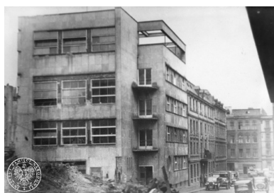
Budynek przy ul. Kobylińskiego 5 - siedziba Wojewódzkiego Oddziału Państwowego Urzędu Repatriacyjnego w Katowicach, 1945-1946 r.

Punkty te powstawały najczęściej w miejscach, które jeszcze niedawno zajmowali jeńcy wojenni, więźniowie lub robotnicy przymusowi, a które po przejściu frontu znalazły się w rękach Armii Czerwonej. Przekazywane urzędnikom PUR, znajdowały się najczęściej w stanie daleko posuniętej dewastacji: powybijane szyby, uszkodzona lub zdemontowana sieć elektryczna i kanalizacyjna, poniszczone sprzęty, brak łóżek i sienników. Brudne i zniszczone pomieszczenia wymagały kompletnego remontu, na co najczęściej nie było środków ani czasu. Tylko dzięki zaangażowaniu pracowników PUR, staraniom urzędników miejskich i ofiarności polskich mieszkańców udawało się w krótkim czasie doprowadzić te miejsca do takiego stanu, by przynajmniej częściowo mogły spełniać wyznaczoną im funkcję, choć i tak warunki w nich panujące były dalekie od wymagań stawianych im w zarządzeniach i zaleceniach przesyłanych z centrali PUR w Łodzi.