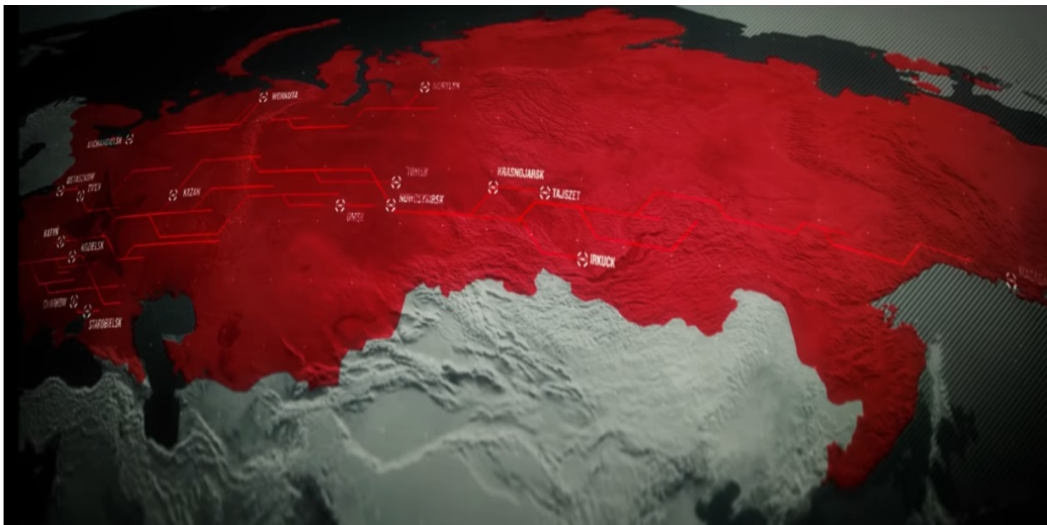
Deportacje Polaków do ZSRS. Kadr z filmu IPN Niezwyyczajeni

https://przystanekhistoria.pl/pa2/tematy/kresy/98793,Na-nieludzka-ziemie.html