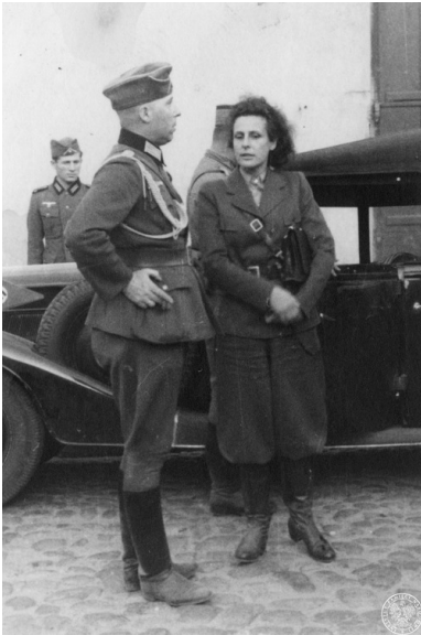
Reżyserka Leni Riefenstahl rozmawia z niemieckim oficerem, prawdopodobnie po przybyciu do miasta. Końskie, 12 IX 1939 r.

Innym ważnym filmem w twórczości Riefenstahl był reportaż, a w zasadzie kronika, z olimpiady w Berlinie w 1936 r., zatytułowany „Olympia”. W dokumencie tym reżyserka zastosowała wiele nowatorskich technik filmowych – wykorzystała różne rodzaje kamer, obiektywów i filtrów, by zarejestrować ruch człowieka. Kręciła także ujęcia w zwolnionym tempie. Pracowała w trudnych warunkach, co wymagało od niej jeszcze większej pomysłowości.