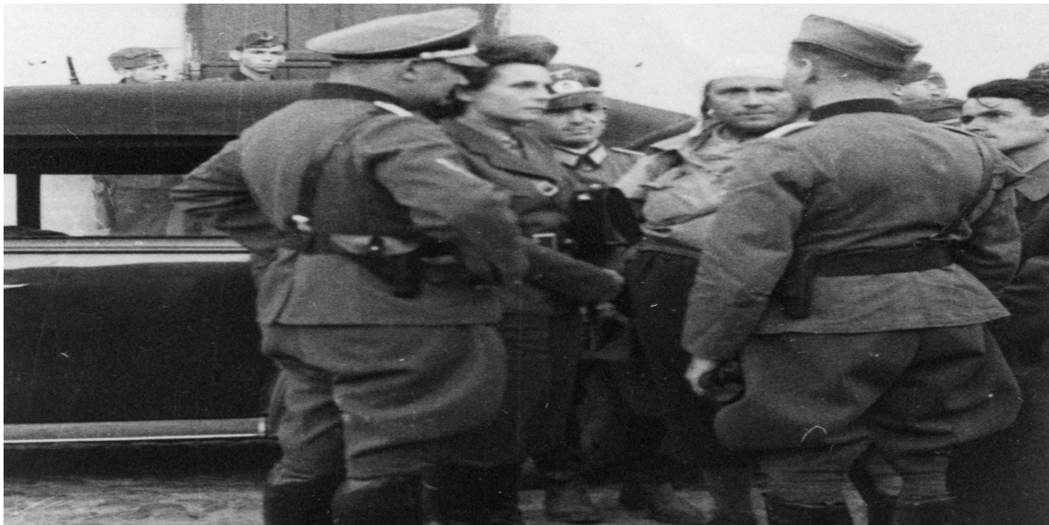
Leni Riefenstahl i towarzyszący jej członkowie ekipy rozmawiają z niemieckimi oficerami, prawdopodobnie po przybyciu do miasta. Końskie, 12 IX 1939 r.

https://przystanekhistoria.pl/pa2/tematy/kultura/101251,Romans-kina-i-swastyki.html