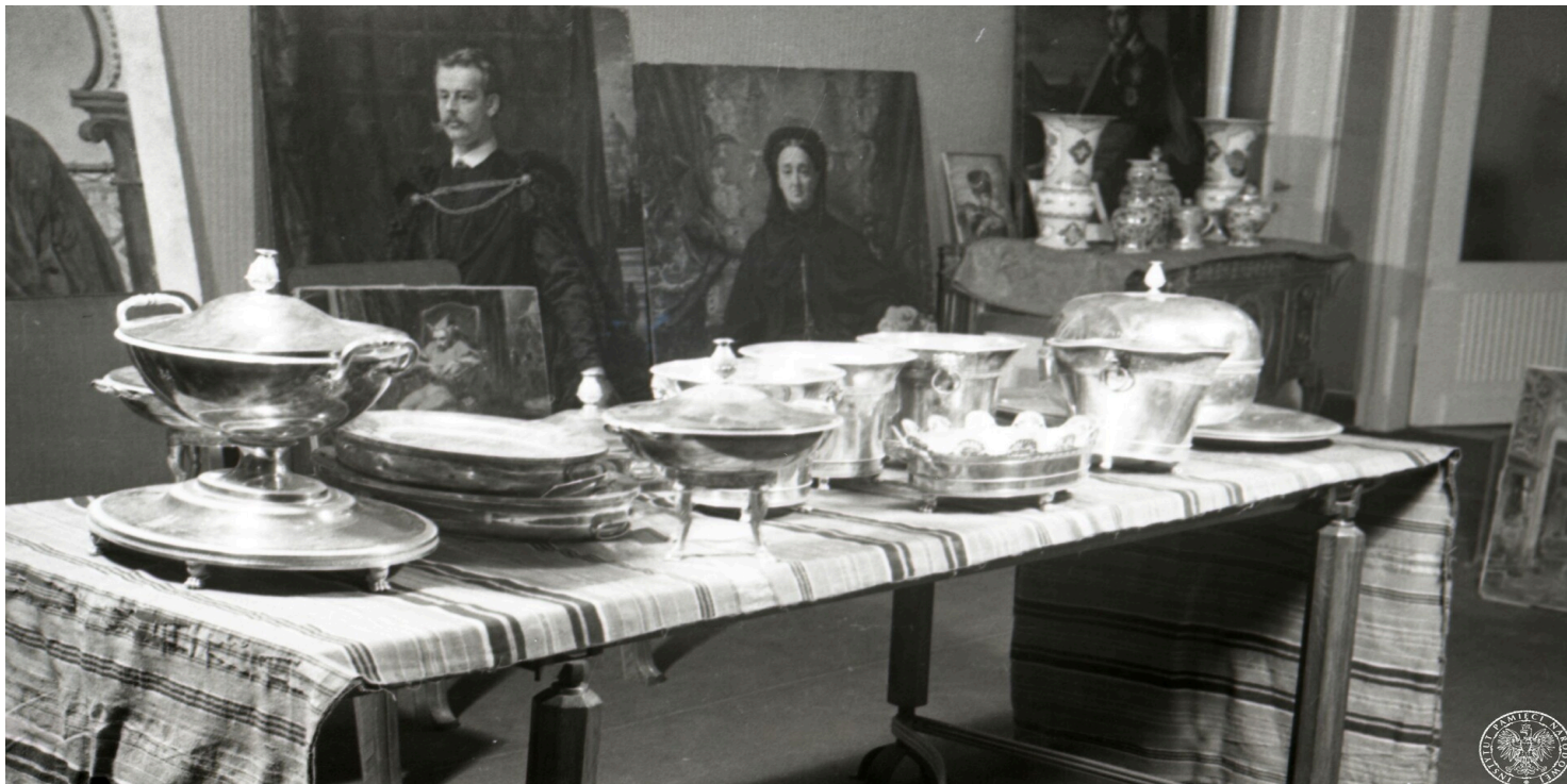
Dzieła sztuki, które hrabia Andrzej Potocki zamierzał wywieźć z Polski.

https://przystanekhistoria.pl/pa2/tematy/kultura/103812,Afera-hrabiego-Potockiego-Przejecie-Kolekcji-Krzeszowickiej.html