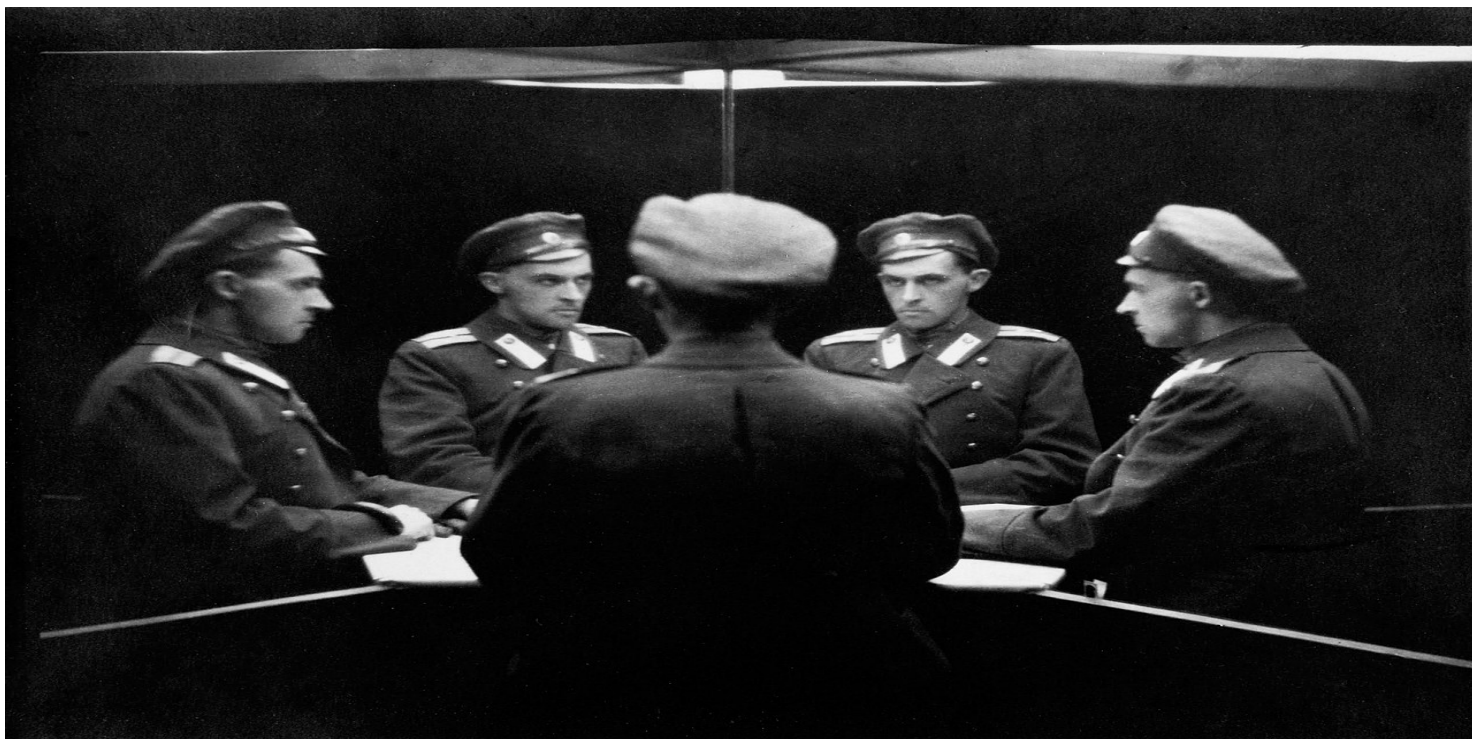
Stanisław Ignacy Witkiewicz, Autoportret wielokrotny w lustrach , 1915-1917.

https://przystanekhistoria.pl/pa2/tematy/kultura/43402,Witkacy-swiadek-poczatku-i-konca-niepodleglosci.html