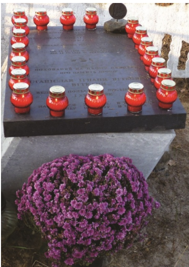
Symboliczny grób Witkacego w Jeziorach.