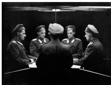
Stanisław Ignacy Witkiewicz, Autoportret wielokrotny w lustrach, 1915-1917.

Witkacy był katastrofistą, ale nie naiwnym i nie w sensie potocznym. Już wcześniej – w czasach optymizmu awangardy lat dwudziestych – wskazywał, że powstający mit nowoczesności, doskonalącego się wciąż świata, ideologia nieustannego postępu mają swą ciemną, nieprzewidywalną i groźną stronę. Opisywał powstawanie nieludzkiej, wynaturzonej rzeczywistości totalitarnej, która splata się nierozzerwalnie z cywilizacją nowoczesności i z odrzuceniem dotychczasowego świata, który człowiek tworzył przez wieki. Miał niesłyszana intuicję przyszłości, nie tylko komunistycznej, której początki sam widział, lecz i tej odleglejszej, której my jesteśmy świadkami, tej niejasnej i nieprzewidywalnej, ale mającej już swą ideologię i przywódców – przyszłości globalizmu. Czy zatem dobrze przewidywał przyszłość? Jest uznawany za jednego z prekursorów egzystencjalizmu, literatury i teatru absurdu, a nawet poglądu o „końcu historii”. Jednak jego prognozy wciąż są aktualne, bo, jak można sądzić, wiele z tego, co przewidywał, jeszcze się nie sprawdziło, może się zdarzyć w niewiadomej przyszłości.