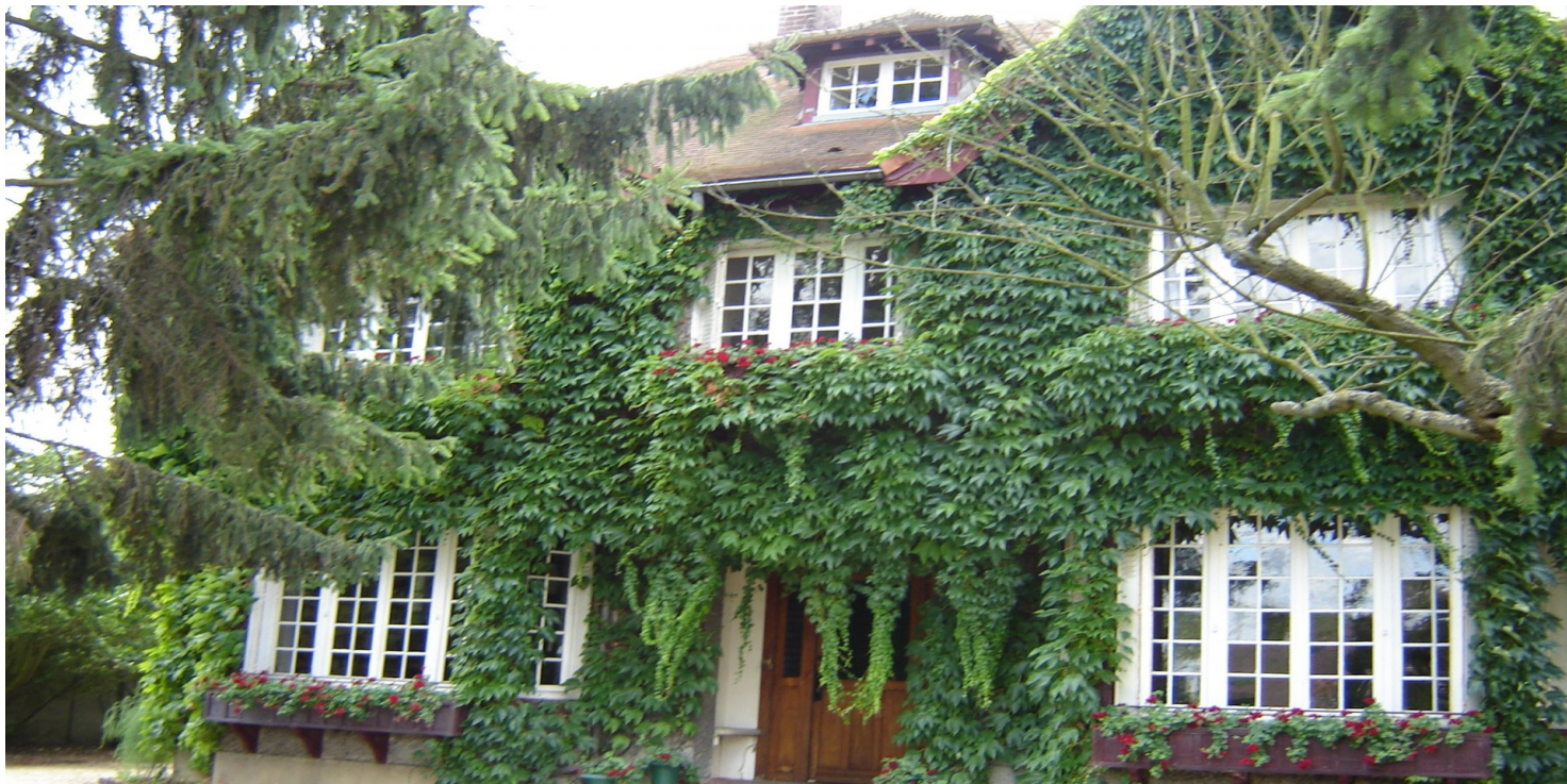
Siedziba Instytutu Literackiego w Maisons-Laffitte, 2006.

https://przystanekhistoria.pl/pa2/tematy/kultura/64341,Smierc-Henryka-Giedroycia-Koniec-Ksiestwa-Giedroyciow-w-Maisons-Laffitte.html