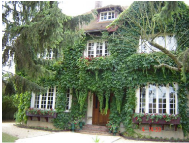
Siedziba Instytutu Literackiego w Maisons-Laffitte, 2006.