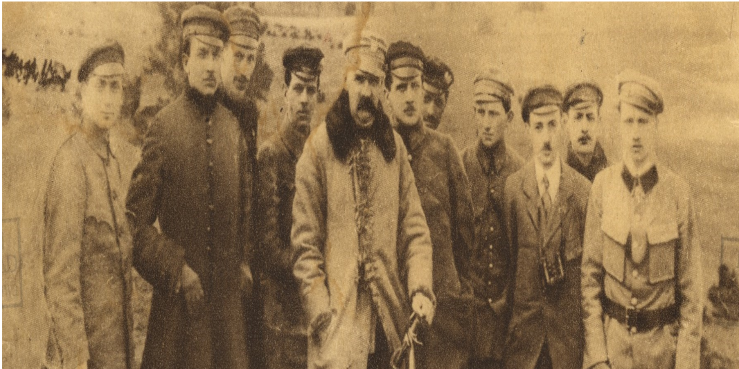
Józef Piłsudski wśród Komendy Naczelnej POW.

https://przystanekhistoria.pl/pa2/tematy/kultura/67371,Umarl-Dziadek-siwy-a-zelazny.html