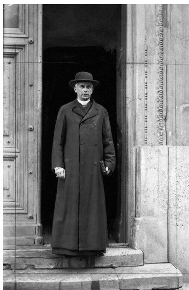
Prymas Polski ks. kard. Edmund Dalbor. 1925 r.

Okazało się, że szczątki figury ocalał jeden z polskich więźniów, których Niemcy zmusili do prac rozbiórkowych przy pomniku. Ukrył je i dyskretnie przekazał swoim bliskim podczas przemarszu kolumny więźniów. Później były przechowywane w prywatnym mieszkaniu poznańskiej rodziny nie tylko podczas okupacji niemieckiej, ale i przez cały okres istnienia PRL.