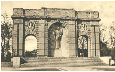
Pomnik Najświętszego Serca Pana Jezusa w Poznaniu. Pocztówka wydana w Krakowie w 1937 r.