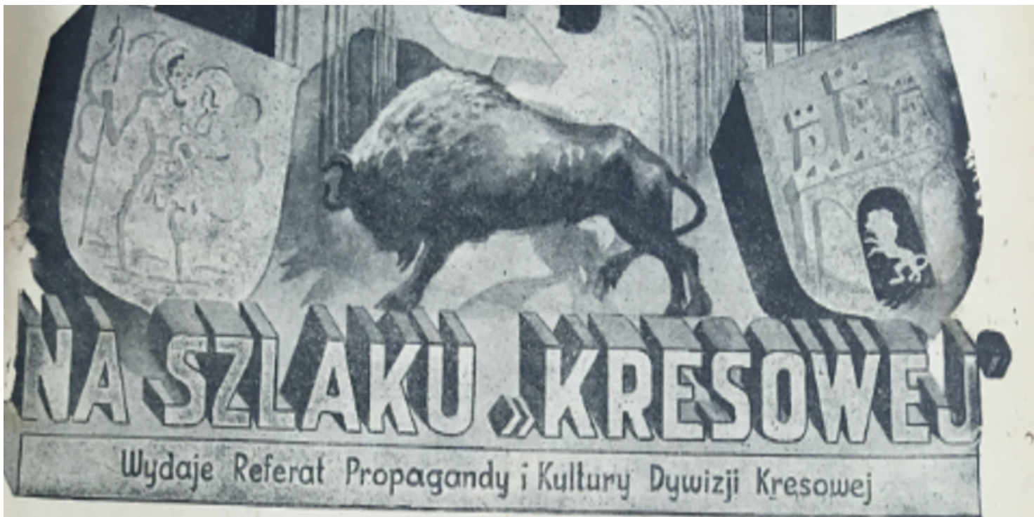
Na szlaku "Kresowej"

https://przystanekhistoria.pl/pa2/tematy/kultura/76831,Mistrz-recenzji-rzecz-o-Jerzym-Woszczyninie.html