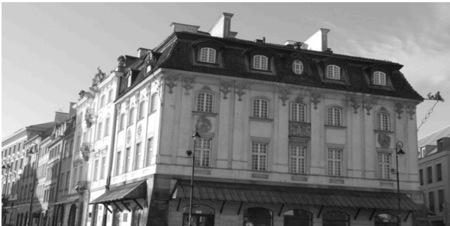
Warszawski Dom Literatury - siedziba ZLP

https://przystanekhistoria.pl/pa2/tematy/kultura/78301,Niedoszly-polski-miesiac-Luty-1968-r.html