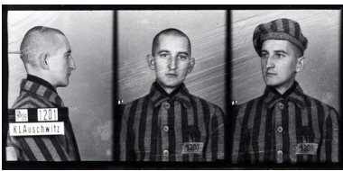
Franciszek Blachnicki w KL Auschwitz, 1940.

Boski dar wolności może być w pełni wykorzystany przez człowieka tylko w połączeniu z miłością. Takie pojmowanie źródeł ludzkiej wolności prowadziło ks. F. Blachnickiego do bezbłędnego diagnozowania przyczyn i form zniewolenia – zarówno osoby ludzkiej, jak i całych społeczeństw. Zniewolenie zawsze ma swoje podstawy w fałszywej wizji ludzkiej wolności. Polega na niewłaściwym użytku z wolności, jest bowiem wypaczeniem miłości przez zwrócenie jej ku sobie 6 .