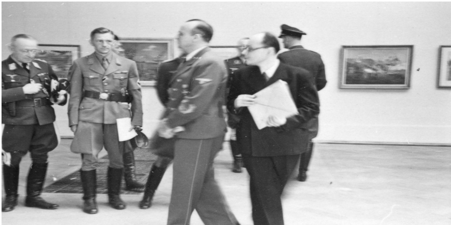
Hans Frank (3 z lewej) w towarzystwie oficerów i cywilów zwiedza nierozpoznaną galerię.

https://przystanekhistoria.pl/pa2/tematy/kultura/81014,Portret-niemieckich-grabiezcow.html