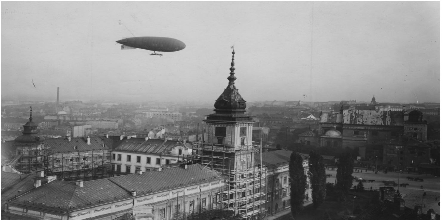
Widok z góry w kierunku południowym na Zamek Królewski i fragment Krakowskiego Przedmieścia - 1926 r. Fot. z zasobu NAC

https://przystanekhistoria.pl/pa2/tematy/kultura/81754,Zamek-Krolewski-w-Warszawie.html