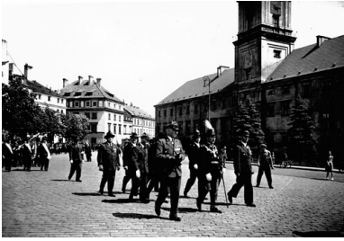
525. rocznica powstania Warszawskiego Bractwa Kurkowego. Prezydium Zjednoczonych Bractw Strzelniczych na placu Zamkowym podczas pochodu 25 czerwca 1939 r. Widoczny Zamek Królewski.