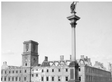
Warszawa, 1939. Zniszczony Zamek Królewski, widoczna także Kolumna Zygmunta na Placu Zamkowym.

Mógłby jednak uczynić to sam pomysłodawca.