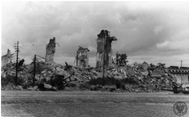
(Jeszcze do niedawna tu była) Warszawa, czerwiec 1945. Ruiny Zamku Królewskiego, widok od strony placu Zamkowego...