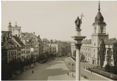
Warszawa, plac Zamkowy, przed 1939.