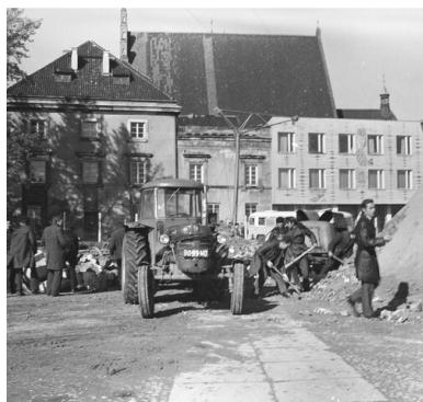
Odbudowa Zamku Królewskiego w Warszawie, październik 1971. W oddali dach katedry św. Jana Chrzyciela.