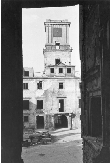
Warszawa, 1939. Zniszczony Zamek Królewski; fragment dziedzińca i wieża.