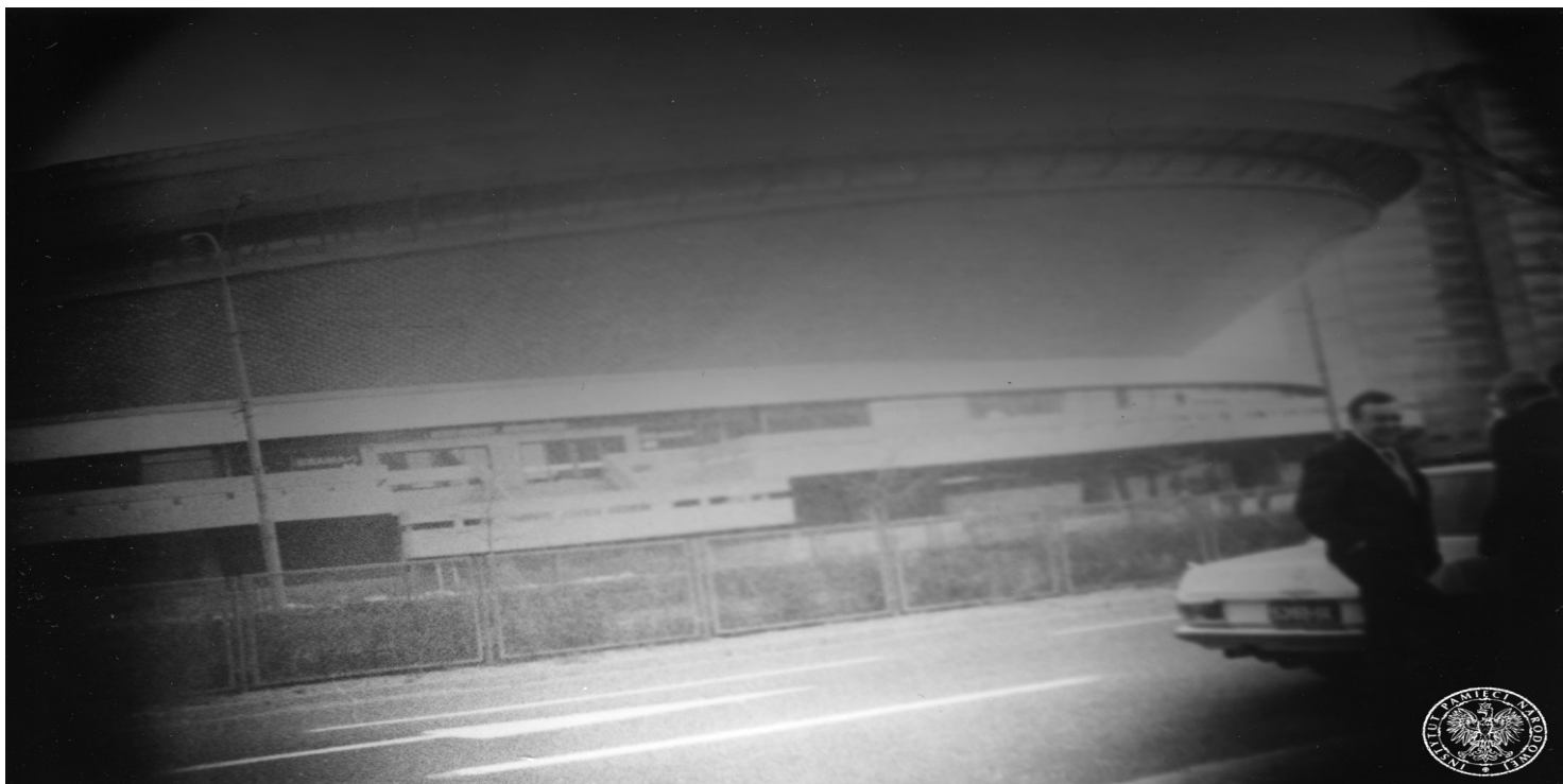
Hala Widowiskowo Sportowa "Spodek" w Katowicach na zdjęciu z obserwacji prowadzonej przez służby PRL.

https://przystanekhistoria.pl/pa2/tematy/kultura/85690,Msza-romantyczna-wazniejsza-niz-zupa.html