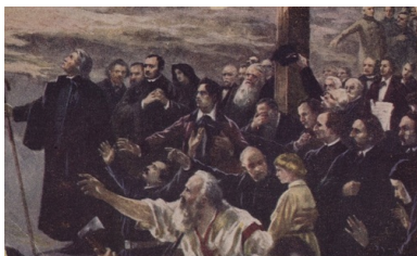
Reprodukcja fragmentu obrazu Jana Styki Polonia z pocztówki ze zbiorów Biblioteki Narodowej