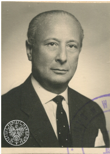
Fotografia przedstawiająca Władysława Szpilmana z akt paszportowych.

Władysław Szpilman po wojnie wrócił do koncertów i komponowania. Koncertował solo i z orkiestrami kameralnymi w Polsce, i na całym świecie. Wrócił do pracy w Polskim Radiu i pełnił tam funkcję dyrektora Działu Muzycznego; do 1963 r. był kierownikiem Działu Muzyki Lekkiej. Był także pomysłodawcą i współorganizatorem, a także dyrektorem orkiestry Międzynarodowego Festiwalu Piosenki w Sopocie.