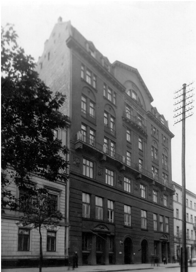
Przedwojenna siedziba Polskiego Radia przy ul. Zielnej 25 w Warszawie, w której pracował Władysław Szpilman.

Szpilman rozpoczął działalność koncertową i zaczął komponować muzykę rozrywkową, filmową, muzykę do słuchowisk radiowych i komedii muzycznych. Zadebiutował piosenką Jeśli kochasz się w dziewczynie . Często występował ze skrzypkiem Bronisławem Gimplem. Od 1935 r. nawiązał współpracę z Polskim Radiem.