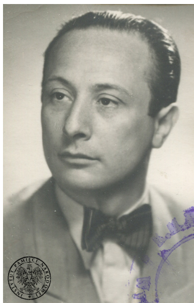
Fotografia przedstawiająca Władysława Szpilmana z akt paszportowych.