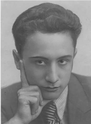
Władysław Szpilman na fotografii z 1934 r.

23 września 1939 r., gdy grał na antenie Polskiego Radia recital złożony z utworów Chopina, niemieckie bomby spadły na elektrownię na Powiślu. Z powodu braku prądu audycja została przerwana. Była to ostatnia wojenna audycja Polskiego Radia. Po wojnie Władysław Szpilman zagrał na antenie Polskiego Radia dokładnie ten sam recital chopinowski przerwany we wrześniu 1939 roku.