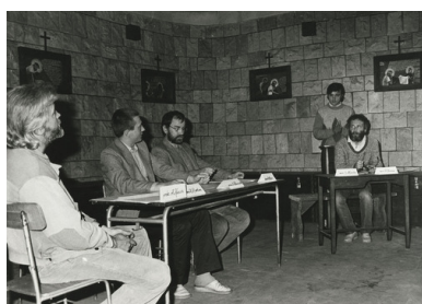
Przedstawienie teatralne „Proces Władysława Frasyniuka” w kościele pw. św. Wawrzyńca we Wrocławiu, 3 czerwca 1985 r.

Zaiste fenomenem był fakt zaproszenia pod ów kościelny parasol również osób, które nie identyfikowały się z religią, religijnością czy szeroko pojętym katolicyzmem, a nawet stały na jego rubieżach lub, co więcej, swoją twórczością prezentowały stanowisko dalekie od wykładni Urzędu Nauczycielskiego Kościoła. Wnętrza kościołów, salki parafialne czy wręcz prywatne mieszkania kapłanów stały się miejscem szerokiej prezentacji sztuki jak najbardziej współczesnej, twórczości żywo reagującej na otaczający świat i aktualne wydarzenia.