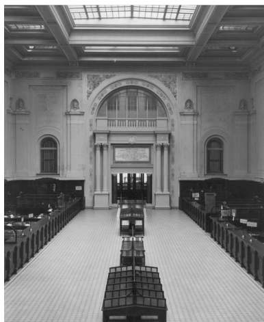
Sala główna Banku Polskiego przy ulicy Bielańskiej 10 w Warszawie, 1928 r.

Ziemię polską i życie społeczne wymagały ujednoczenia i likwidacji podziałów powstałych wskutek przynależności do trzech państw zaborczych, różniących się od siebie politycznie i gospodarczo. Proces ten dotyczył również sfery mentalnej – mieszkańcy Polski musieli nauczyć się traktować państwo i jego władze jak własne i uświadomić sobie obowiązki spoczywające na nich jako obywatelach Rzeczypospolitej. Nie było to łatwe, tym bardziej, że odzyskanie niepodległości odbyło się bez udziału większości spośród nich. W budowie państwa przydatne okazały się zdolności organizacyjne wyrobione w czasach niewoli, ukształtowane nurty polityczne oraz wielki entuzjazm elit społecznych dla idei pracy na rzecz niepodległej Polski.