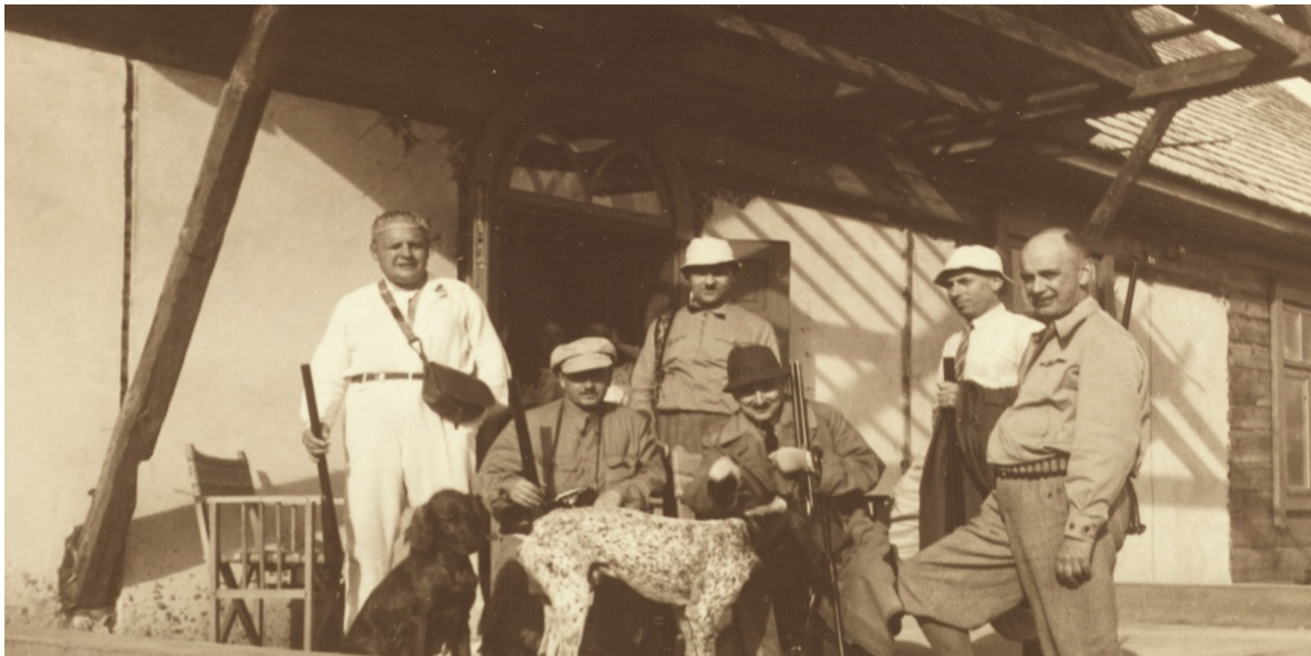
Melchior Wańkowicz (z lewej) wśród ziemiaństwa, przed 1939 r.

https://przystanekhistoria.pl/pa2/tematy/kultura/92171,Podroz-Wankowicza-po-Prusach-Wschodnich-Na-tropach-Smetka-w-swietle-dokumentow-n.html