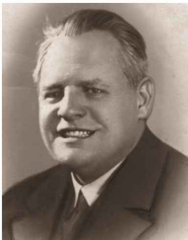
Melchior Wańkowicz, przed 1939