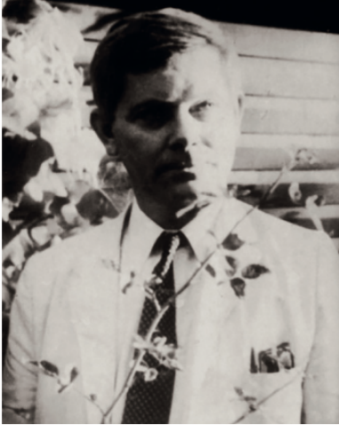
Zbigniew Herbert

Z jakich jeszcze treści składa się ta Ojczyzna? Otóż są to przeważnie rzeczy i sprawy zwyczajne, znane i doświadczane powszechnie. Po pierwsze, rodzina, krewni, a z nimi dom, nazywany „gniazdem” 3 początkowo wprost, później peryfrastycznie: