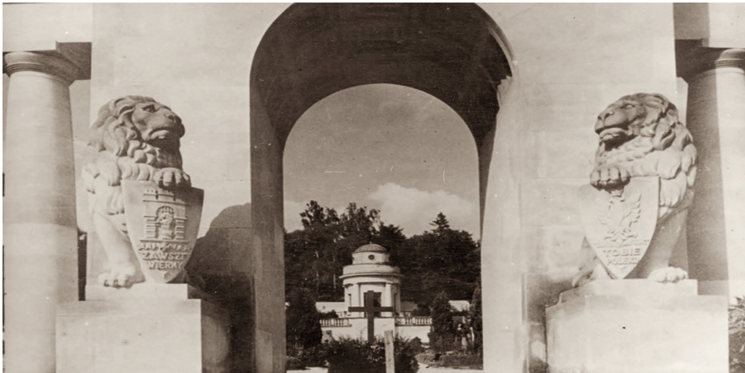
Cmentarz Orłąt we Lwowie, przed 1939 r.

https://przystanekhistoria.pl/pa2/tematy/kultura/93557,Pamiec-i-Ojczyzna-w-poezji-Zbigniewa-Herberta.html