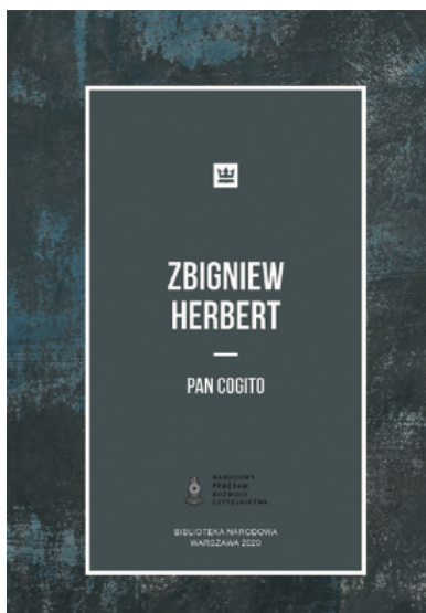
Zbigniew Herbert Pan Cogito

Zwykle jednak i sama aktywność pamięci, i jej treści są w twórczości Herberta przedmiotem świadomego wyboru. Bywa on przeciwstawiany pokusom zapomnienia, zawsze odrzucanym, nieraz wprost określonym jako grzech 30 . Choćby wybór pamięci wymagał sprzeciwu wobec „chóralnie” propagowanych pokus, choćby