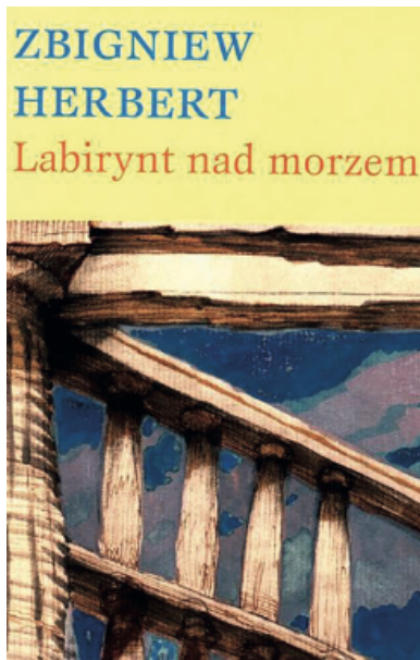
Zbigniew Herbert Labirynt nad morzem