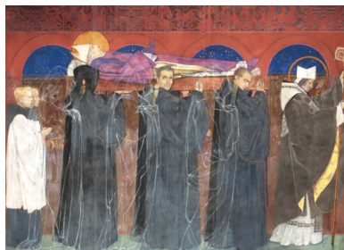
Jan Henryk Rosen, Pogrzeb św. Odilona. 1927 r. Fresk w katedrze ormiańskiej we Lwowie, przedstawiający XI-wiecznego opata Cluny, który ustanowił Święto Zmarłych, ilustruje ideę ciągłości i wspólnoty pokoleń, komunii żyjących i zmarłych, świętych obcowania

przeciwko komunistycznej okupacji. Przez większą część życia Herberta – w Polsce Ludowej – nie wolno było o tych ludziach wspominać, zatem poeta, posługując się językiem ezopowym, mówił o sobie aluzyjnie, że pozostaje z umarłymi w konspiracji. To tej właśnie „konspiracji wyobraźni” 46 udziela pamięć, poprzez prawdę świadectwa, swojej zdolności do transcendencji – „swej nieskończoności” 47 – jak w Modlitwie starców „w ciemnym wnętrzu biały rośnie kościół” 48 .