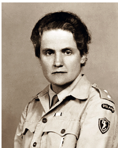
Karolina Lanckorońska we Włoszech jako oficer prasowy przy 2. Korpusie Polskich Sił Zbrojnych na Zachodzie, 1945 r.

Karla (tak ją nazywali krewni i znajomi) Lanckorońska miała duże osiągnięcia naukowe w dziedzinie badań historycznych, zwłaszcza dotyczących sztuki i archiwistyki. Była pierwszym docentem-kobietą na Uniwersytecie Jana Kazimierza we Lwowie i pierwszą docentką w dziejach naszej historii sztuki. We Włoszech organizowała studia dla 1,3 tys. młodych żołnierzy 2. Korpusu Polskiego. Była współzałożycielką, a potem kierownikiem wspomnianego Polskiego Instytutu Historycznego, gdzie redagowała kilka serii wydawniczych o wielkiej wartości: 28 tomów rocznika „Antemurale” oraz zbiory dokumentów historycznych „Elementa ad Fontium Editiones” (76 tomów).