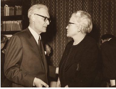
Kazimierz Wierzyński i Karolina Lanckorońska w Bibliotece Polskiej w Londynie, 1969 r.

Nazizm traktowała ta duchowa arystokratka i uczona humanistka z pogardą za nieludzkie okrucieństwo i prostactwo, jednak trudnym problemem było dla niej oddzielenie wielkiego dorobku kultury niemieckiej od współczesnego barbarzyństwa narodowych socjalistów wychowanych w tej kulturze. Totalitaryzm nazistowski został dość szybko pokonany, a potem pozostał palącym problemem niemieckim.