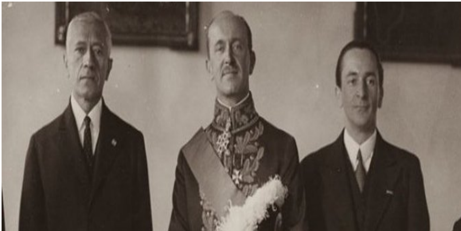
Jan Gawroński (w środku) – poseł nadzwyczajny i minister pełnomocny RP w Wiedniu, 1934 r.

https://przystanekhistoria.pl/pa2/tematy/kultura/94144,Konserwatywno-katoliccy-interpretatorzy-dwudziestowiecznej-historii-z-wloskiej-d.html