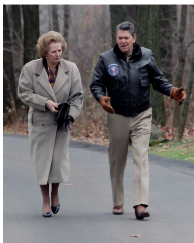
Brytyjska premier Margaret Thatcher i amerykański prezydent Ronald Reagan

– tymi słowami zwrócić się miał do członków KC PZPR generał Wojciech Jaruzelski w reakcji na plany złożenia przez Margaret Thatcher kwiatów na grobie kapłana zamordowanego przez SB w 1984 r., podczas zbliżającej się, pierwszej w historii, wizyty premiera Zjednoczonego Królestwa w Polsce.