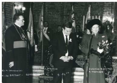
Prałat Henryk Jankowski, Lech Wałęsa i Margaret Thatcher w kościele pw. św. Brygidy w Gdańsku, 4 listopada 1988 r.

Wizyta premier Thatcher w Polsce nie przyniosła oczekiwanych przez władze PRL efektów. Rząd Wielkiej Brytanii nie wstawił się za Polską w Klubie Paryskim w sprawie jej zagranicznych długów. Wizyta dała za to nadzieję polskiej opozycji na uzyskanie poparcia Zachodu w wywieraniu nacisków na coraz bardziej osłabione władze.