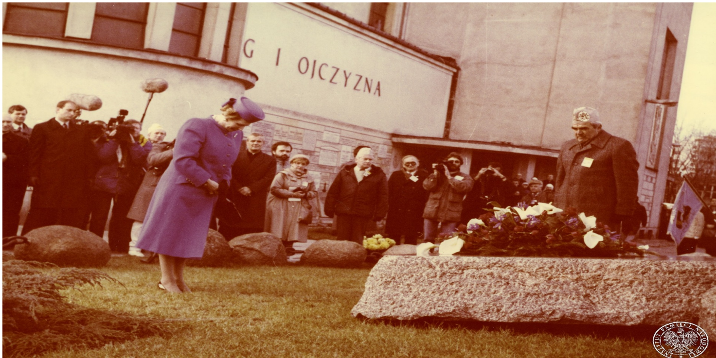
Margaret Thatcher podczas składania kwiatów na grobie ks. Jerzego Popiełuszki w Warszawie, 3 listopada 1988 r.

https://przystanekhistoria.pl/pa2/tematy/lech-walesa/96315,Margaret-uwazaj-na-czerwonego-pajaka-Wizyta-Margaret-Thatcher-w-Polsce.html