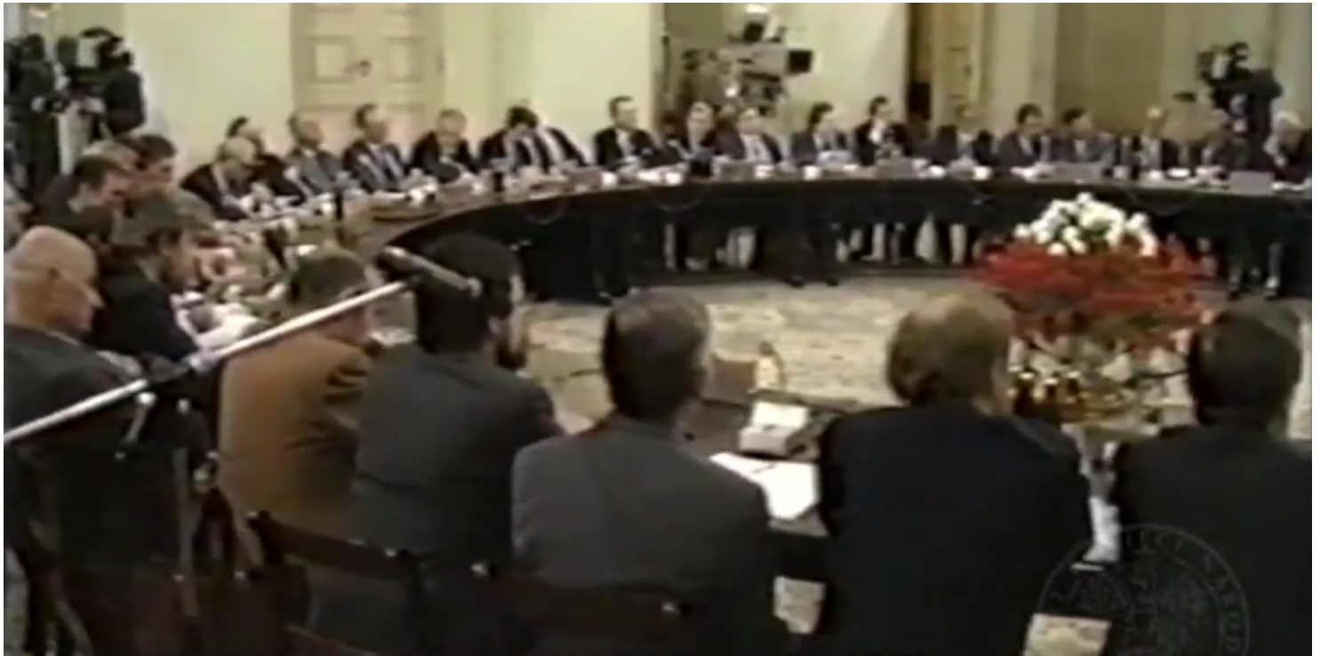
Kadr z kroniki filmowej

https://przystanekhistoria.pl/pa2/tematy/lech-walesa/99888,Okragly-stol.html