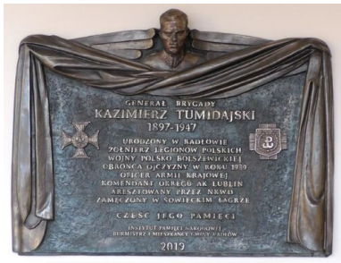
Tablica na ścianie Urzędu Miejskiego w Radłowie poświęcona Kazimierzowi Tumidajskiemu

Tekst pochodzi z serii Małopolscy Bohaterowie Września 1939