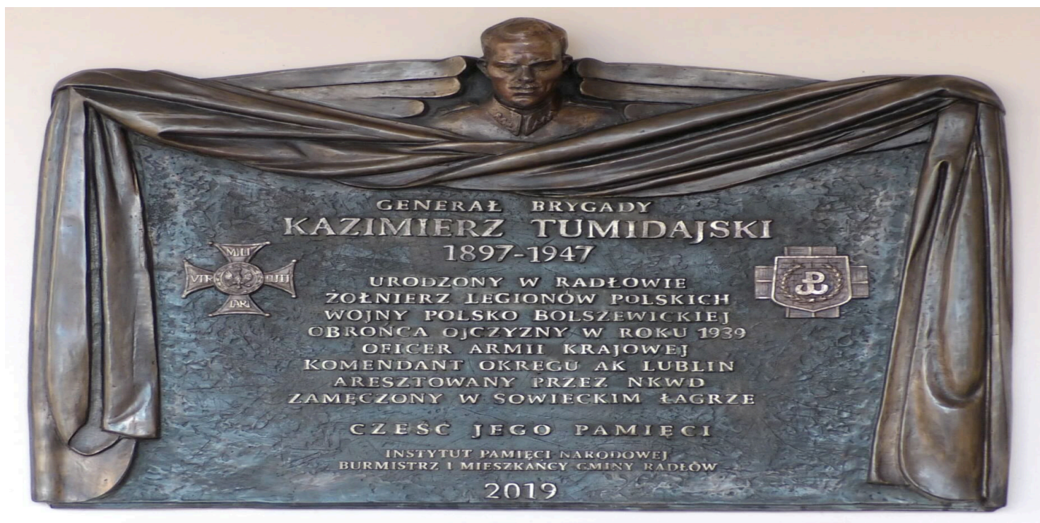
Tablica na ścianie Urzędu Miejskiego w Radłowie poświęcona Kazimierzowi Tumidajskiemu

https://przystanekhistoria.pl/pa2/tematy/legiony/104625,Kazimierz-Tumidajski-1897-1947.html