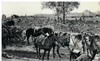
Odoczynek oddziałów legionowych pod Jastkowem, 1915.