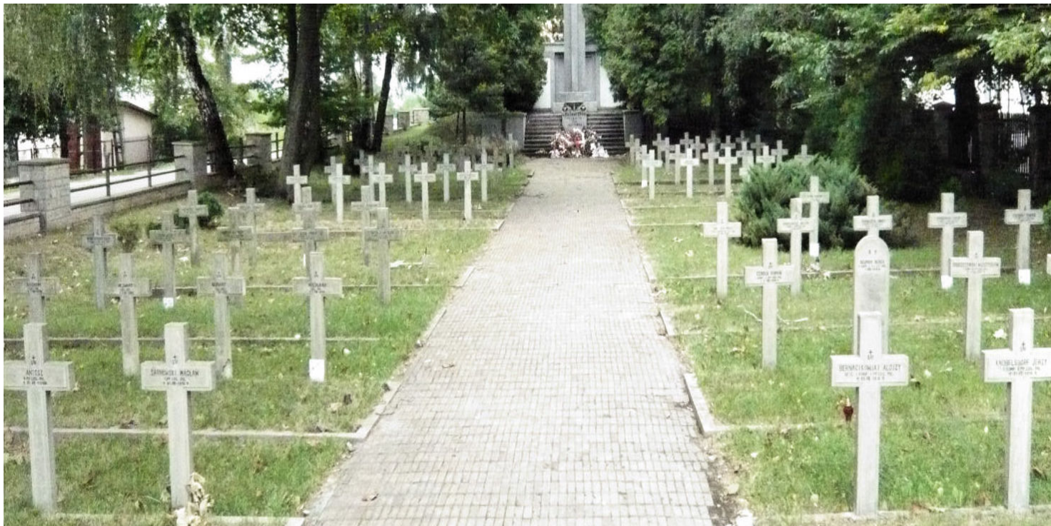
Cmentarz Legionistów Polskich w Jastkowie

https://przystanekhistoria.pl/pa2/tematy/legiony/72108,Legiony-Polskie-pod-Jastkowem-31-lipca-3-sierpnia-1915-r.html