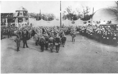
Strzelcy na krakowskich Oleandrach, sierpień 1914 r.

Kalkulacja Piłsudskiego zawiodła. Wprawdzie rzucił iskrę, jednak materiał wybuchowy okazał się wilgotny. Szybko przekonali się o tym żołnierze Kadrówki. 12 sierpnia strzelcy wkroczyli do opuszczonych przez Rosjan Kielc. Chłodne przyjęcie, choć nieco przerysowane, przeszło do legendy. Jednak entuzjazmu rzeczywiście nie było. Z jednej strony obawiano się szybkiego powrotu Rosjan, z drugiej zaś spoglądano na strzelców jako formację proniemiecką.