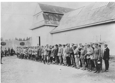
Strzelcy na krakowskich Oleandrach, sierpień 1914 r. (fot.

Piłsudski chciał pod osłoną państw centralnych wzniecić insurekcję antyrosyjską, Austriacy widzieli szansę na wywołanie na tyłach armii rosyjskiej dywersji umożliwiającej sprawne i szybkie zakończenie kampanii. Dalszych perspektyw nie było.