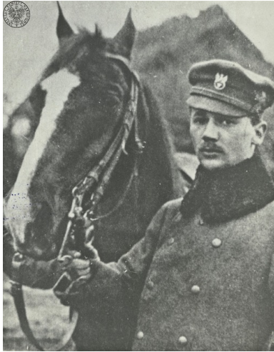
Mjr Tadeusz Furgalski „Wyrwa” z I Brygady Legionów na froncie wschodnim nad rzeką Stochód, 1916 r.