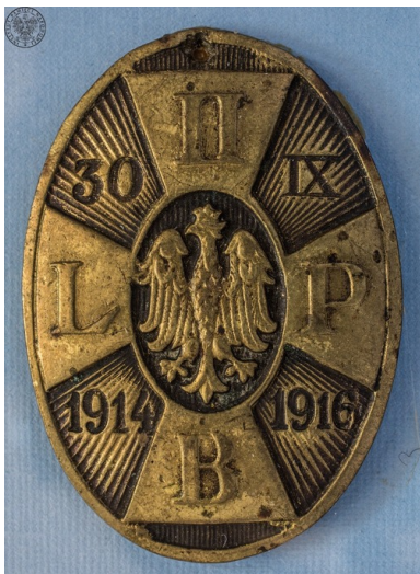
Odznaka pamiątkowa II Brygady Legionów Polskich.