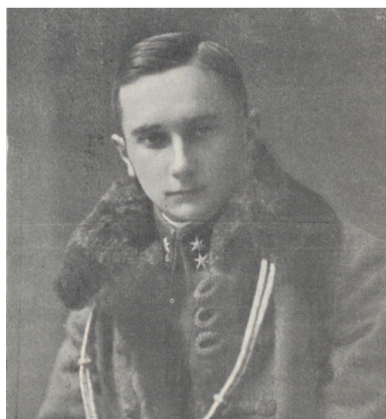
Mieczysław Prus-Więckowski w stopniu porucznika z okresu służby w Legionach Polskich

Służy dzielnie i szybko awansuje do stopnia kapitana.