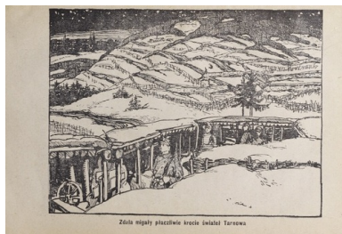
Ilustracja z książki Boje legionistów polskich. Bitwa pod Łowczówką, Piotrków 1916.

Piestrzyńskim spać na paki z opatrunkami, ale znów cała noc bezsenna. Głodni, brudni, bez zdejmowania butów od czterech dni, uważamy się i tak za uprzywilejowanych wobec naszych chłopców, którzy te cztery dni siedzą w okopach, na zimnie, często o trzydzieści kroków od Moskali. W tę noc wigilijną chłopcy nasi w okopach zaczęli śpiewać »Bóg się rodzi«... I oto z okopów rosyjskich Polacy, których dużo jest w dywizjach syberyjskich, podchwycili słowa pieśni i poszła w niebo z dwóch wrogich okopów! Gdy nasi po wspólnym odśpiewaniu kolęd krzyknęli: »Poddajcie się, tam, wy Polacy!« nastąpiła chwila ciszy, a później – już po rosyjsku: » Sibirskije strietki nie sdajutsia «. Straszna jest wojna bratobójcza. Podobno jeden z naszych młodych chłopców wziął do niewoli ojca swego, którego zabrali do wojska rosyjskiego”.