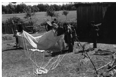
Dzielenie czaszy spadochronu pochodzącej ze zrzutów zaopatrzenia dokonywanych przez samoloty RAF w Puszczy Kampinoskiej.