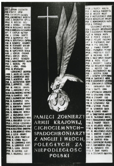
Warszawa, ul. Freta 10, kościół pod wezwaniem św. Jacka (OO. Dominikanów). Tablica poświęcona pamięci poległych cichociemnych.