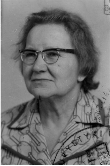
Elżbieta Magdalena Zawacka ps. „Zo”, „Sulica”, „Zelma”. Jedyna kobieta-cichociemna, generał brygady Wojska Polskiego.