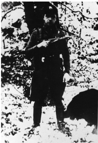
Mjr Jan Piwnik ps. „Ponury”. 8 listopada 1941 r. zrzucony do Polski, zginął 16 czerwca 1944 r. w Jewłaszach (woj. nowogródzkie II RP).