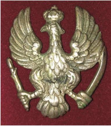
Orzełek powstańczy znaleziony na ziemiach zabranych. Zbiory autora