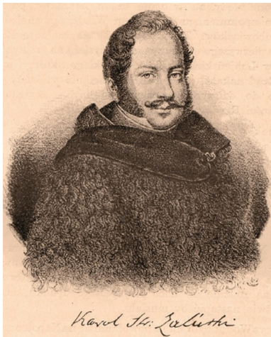
Karol Załuski, naczelnik powstania na Litwie