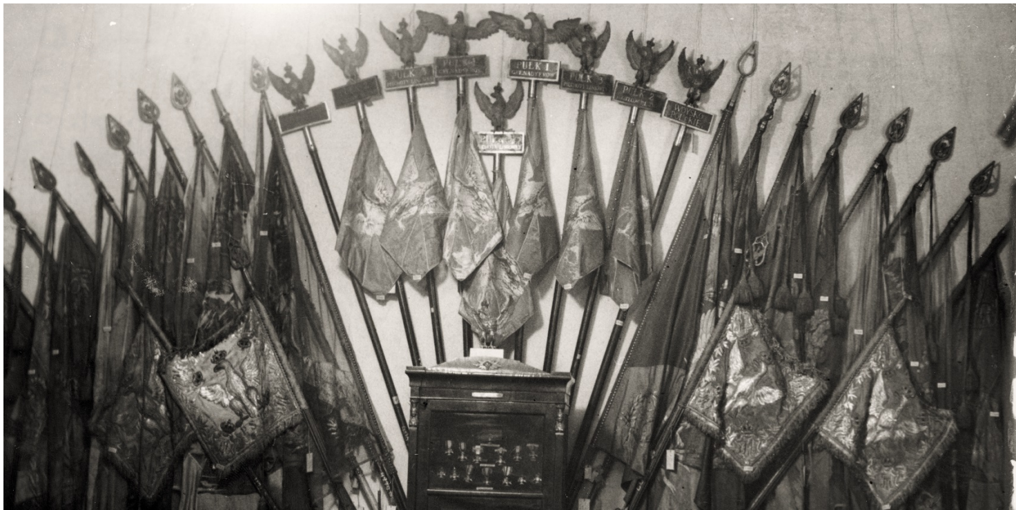
Fragment wystawy w Muzeum Narodowym w Warszawie okazji 100 rocznicy powstania listopadowego, 1931 r.

https://przystanekhistoria.pl/pa2/tematy/litwa/43414,Jelismy-sie-oreza-w-uchu-jednosci-z-Krolestwem-Polskim-Powstanie-Listopadowe-na.html