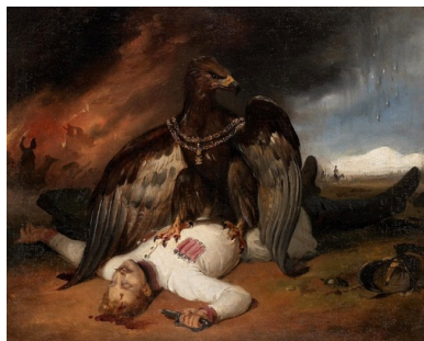
Horace Vernet - Polski

Powstanie 1831 r. na Litwie stało się świadectwem jedności i całości przedrozbiorowych ziem Rzeczypospolitej Obojga Narodów. Powstańcy litewscy walczyli nie o niepodległość Litwy jako odrębnego tworu państwowego, lecz o wolność i całość Rzeczypospolitej w jej przedrozbiorowym kształcie. Co więcej, mieli do tego poparcie wszystkich mieszkańców tego terenu, nie tylko Polaków, ale też Litwinów oraz rusińskich unitów (dzisiejszych Białorusinów, zmuszonych przez rząd carski do przejścia na prawosławie). Dopiero powstałe na przełomie XIX i XX w. nacjonalizmy przekreśliły ten charakterystyczny dla opisywanej epoki sposób myślenia i działania.