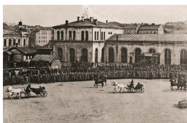
Przyjazd Naczelnika Państwa Józefa Piłsudskiego do Wilna. Powitanie na dworcu kolejowym. Kwiecień 1919 r.

ochotniczym (Freikorps). Z początkiem 1919 r. władze niemieckie wyraźnie jednak zaostrzyły swoją politykę w stosunku do polskiego samorządu, otwarcie wspierając litewskie roszczenia terytorialne. Dzięki temu Litwini usunęli z Sejm polskiego naczelnika i 15 stycznia powołali Litewski Komitet Powiatowy, który kontrolował cały powiat sejneński oraz północno-wschodnią część powiatu suwalskiego wraz z Puńskiem. W styczniu 1919 r. został utworzony litewski oddział milicji, który został uzbrojony w broń odkupioną od Niemców. Aby wymusić wykonywanie poleceń władz litewskich, milicja aresztowała kilku polskich urzędników i usiłowała zastraszyć pozostałych. Pod koniec marca szef niemieckiego zarządu w Suwałkach poinformował przedstawicieli Rady o przekazaniu Suwałk i m.in. powiatu suwalskiego i augustowskiego Litewskiej Radzie Państwowej (Taryba), która została uznana przez władze niemieckie za suwerenną władzę na terenie byłego gubernatorstwa litewskiego. Z początkiem maja do Suwałk wkroczyły oddziały litewskie, a na początku lipca przybyli pierwsi urzędnicy litewscy, którzy usiłowali przejąć administrację powiatu i tworzyć własne instytucje.