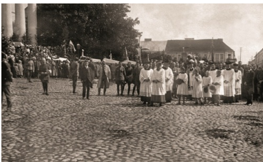
Pogrzeb poległych powstańców sejneńskich. Kondukt żałobny z trumnami poległych przed kościołem św. Aleksandra w Suwałkach. 28 sierpnia 1919 r.

Zajęta przez oddziały polskie linia została ponownie potwierdzona 8 grudnia 1919 r. przez Radę Najwyższą państw Ententy jako północny odcinek granicy terenu bezspornie przyznanego Polsce. Należy w tym miejscu przypomnieć, że na skutek zdecydowanego stanowiska polskich mieszkańców Wisztyńca i Lubowa oraz pobliskich im okolic, na podstawie polsko-litewskich ustaleń w Czerwonce (6 września), od września 1919 do lipca 1920 r. obie miejscowości należały do Polski i administracyjnie przydzielone były do powiatu suwalskiego. Latem 1920 r. ruszyła ofensywa Armii Czerwonej, zmuszając oddziały polskie do wycofania się. W lipcu 1920 r. na podstawie postanowień rosyjsko-litewskiego traktatu pokojowego zawartego w Moskwie Wileńszczyzna i Grodzieńszczyzna miały zostać przekazane Litwie. Ponadto, wobec odwrotu wojsk polskich, Litwini naruszając