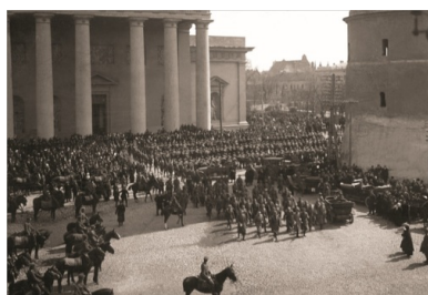
Oddziały Wojska Polskiego przed katedrą św. Stanisława i św. Władysława w Wilnie po uroczystym nabożeństwie, 22 kwietnia 1919 r.

Wierzył, że możliwe jest zrealizowanie idei państwa federacyjnego, wielonarodowego, w którego granicach przywrócono by świetność dawnej Rzeczypospolitej. Jednak już w kilka dni po wyzwoleniu Wilna i rozpoczęciu rozmów z lokalną elitą polityczną, musiał przyznać, że nie znalazł zwolenników szerszego porozumienia, w zamyśle przygotowującego grunt dla przyszłej realizacji koncepcji federacyjnej. Nawet miejscowi Polacy „ogłądali się na Warszawę” i nie akceptowali przyszłości innej niż wcielenie ich ziem do Polski. Uważali, że z powodów historycznych, statusu majątkowego i poziomu rozwoju kulturalnego do nich należy pierwszoplanowa rola przy decydowaniu o sprawach byłego WKL.