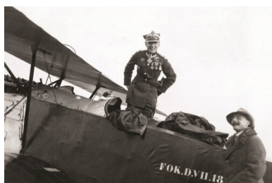
Płk Jerzy Kossowski w kabinie myśliwca Fokker D.VII 18-7; zdjęcie wykonane prawdopodobnie na lotnisku w Lidzie między majem a wrześniem 1925 r.

Lotniczych 12 . W 1930 r. zaprezentował możliwości samolotu PZL P.1 na pokazie lotniczym w Bukareszcie, za co otrzymał powinszowanie od króla Karola II. W 1932 r. uczestniczył w Międzynarodowych Popisach Lotniczych w Cleveland (USA), pilotując myśliwiec PZL P.11. Pięć lat później zakończył współpracę z lotnictwem cywilnym i zamieszkał w Bydgoszczy.