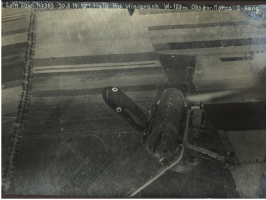
Hala sterowcowa w podpoznańskich Winiarach (tzw. hala Zeppelina), sierpień 1919 r.