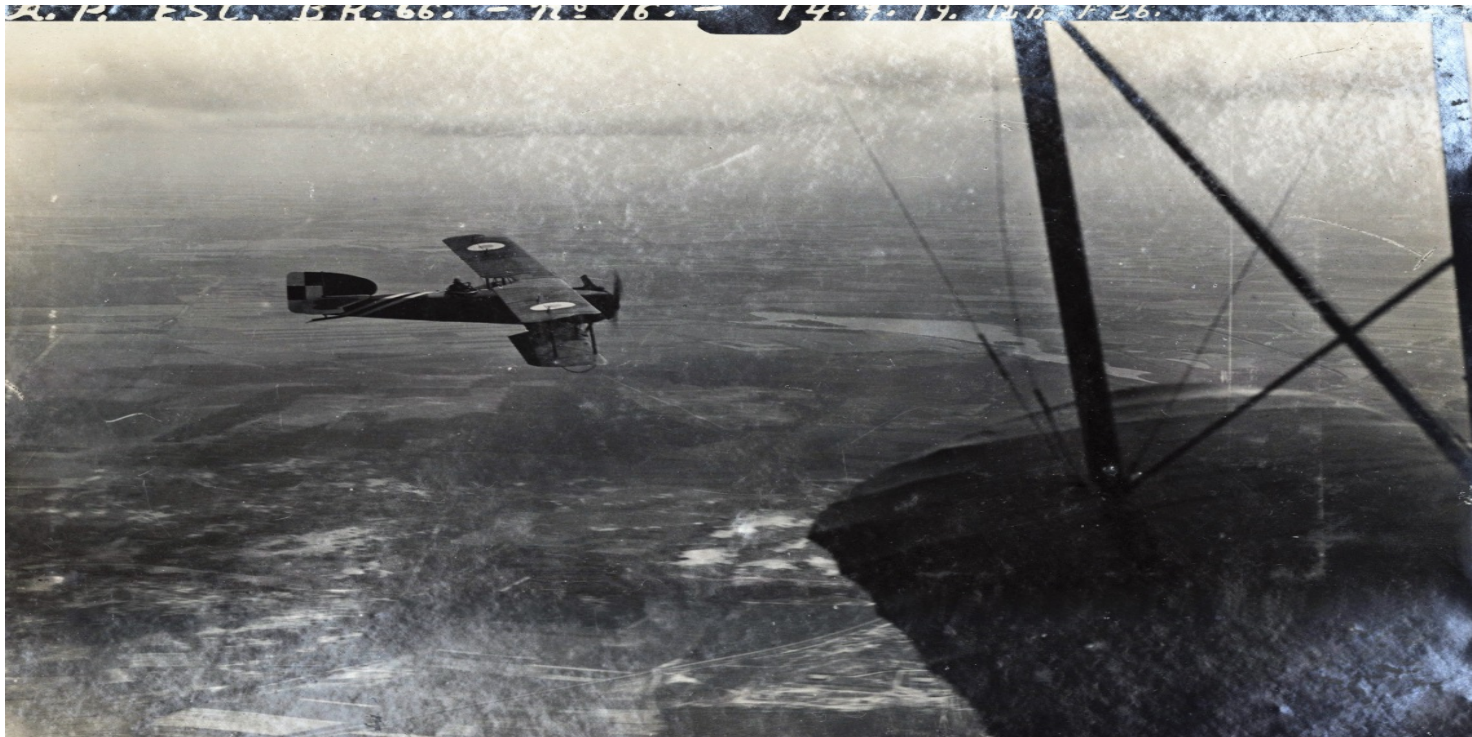
Samolot Bréguet XIVB2 w polskim malowaniu nad Wielkopolską, 14 lipca 1919 r. Fot. ze zbiorów Biblioteki Narodowej

https://przystanekhistoria.pl/pa2/tematy/lotnictwo/93377,Wiktor-Pniewski-18911974-w-sluzbie-Polskich-Skrzyd el.html