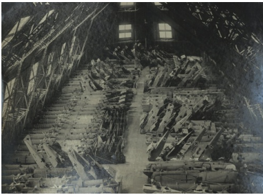
Wypełnione zdobycznymi płatownikami wnętrze hali sterowcowej w podpoznańskich Winiarach, 1919 r.

Nasz bohater, który miał swój udział w zdobyciu przez powstańców lotniska w Ławicy w nocy z 5 na 6 stycznia 1919 roku, z miejsca został mianowany jej pierwszym polskim komendantem. Już nazajutrz – jak pisał po latach nie kryjąc wzruszenia –