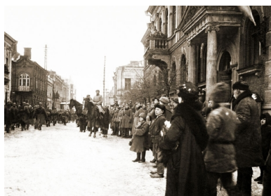
5. Pułk Piechoty Legionów Wojska Polskiego w Dyneburgu w styczniu 1920 r.

Sztab Rydza-Śmigłego przybył ze Święcian do Dukszt 1 stycznia. Przeprowadzono narady z dowództwem 3. Dywizji Legionów, dwa dni później zaś, 3 stycznia o 6.00 Rydz-Śmigły, a kilka godzin po nim dowódca Frontu Litewsko-Białoruskiego gen. Stanisław Szeptycki zjawili się w pałacu w Kałkunach, aby stamtąd obserwować przebieg operacji.