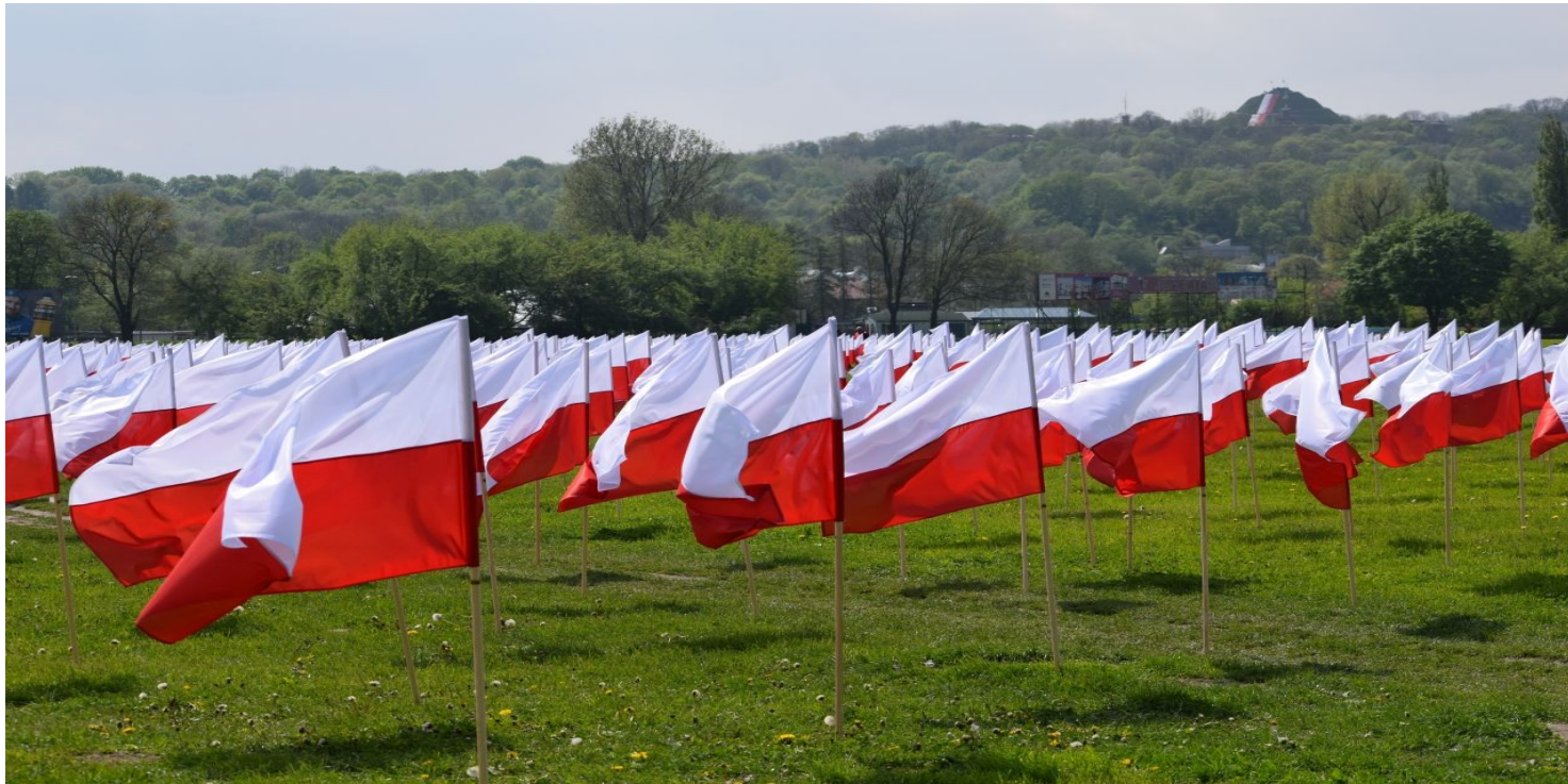
Dzień Flagi w Krakowie, 2 maja 2019 r.

https://przystanekhistoria.pl/pa2/tematy/maj-1946/81263,Wokol-symboli-narodowych-i-Swieta-Trzeciego-Maja.html