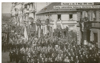
Pochód 3 maja 1916 r. w Warszawie

Zaborcy widząc moc symboliczną związaną z tym dniem zgodnie zakazali obchodzenia tego święta, chociaż już w końcu XIX wieku w zaborze austro-węgierskim go nie zwalczano. Mimo to, Polacy pamiętali i nie brakowało działań, które miały o nim przypominać: mszy świętych, utajnionego składania kwiatów, spotkań... Prawdziwą manifestację urządzili nasi przodkowie w czasie I wojny światowej – 3 maja 1916 roku, gdy w uroczystym pochodzie w Warszawie uczestniczyło, jak się szacuje, ponad 200 tys. osób.