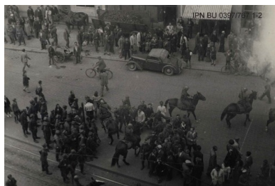
Milicja na koniach rozpędza studentów na Świętym Marcinie,

Pierwsze kule wystrzelono do manifestantów na Rynku Głównym z budynku Polskiej Partii Robotniczej. Ranne zostały wówczas dwie osoby. Nie potwierdzone informacje mówią także o kilku ofiarach śmiertelnych. W pamięci uczestników tych wydarzeń zachował się obraz samochodu pancernego z zamontowanym sprzężonym karabinem maszynowym, którym po krakowskich Plantach jeździł szef tutejszej bezpieki strzelając nad głowami manifestantów. Miasto spacyfikowano aresztując blisko tysiąc osób. W lipcu przeprowadzono pokazowy proces kilku z zatrzymanych. Wskutek represji, które spadły na demonstrantów, m.in. harcerzy, uczniów i studentów, w wielu miejscowościach doszło do trwających nawet do kilkunastu dni strajków w szkołach i na uczelniach. Władzy udało się opanować sytuację dopiero w czerwcu, a w kolejnych miesiącach organizowano procesy osób uznanych za „prowodyrów” zajęć. Pod dużą presją społeczną komuniści zadbali o orzekanie stosunkowo łagodnych wyroków, większość skazanych opuściła więzienie już po kilku miesiącach.