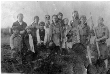
Polscy deportowani z Łomży i ze Lwowa

Latem, w dni wolne od pracy matki zabierały starsze dzieci do lasu zbierać jagody, borówki, żurawinę oraz grzyby. Bardzo popularne były „gruzdzi”, czyli białe grzyby wyglądem przypominające rydze. Zebrane grzyby suszono, bądź też solono i zimą podawano na obiad zamiast mięsa. Uzbierane jagody przesmażano natomiast na powidłach. Pozostałą część zbiorów wymieniano w pobliskim kołchozie na ziemniaki, kaszę, czy też zboże. Dzięki tym „zdobyciom” można było ugotować zupę, która była często jedynym posiłkiem w ciągu całego dnia. Zbierano także, pozostałe po wykopkach w polu, zgniłe ziemniaki – myto je, duszono, dodawano trochę mąki, a następnie pieczono z nich placki.