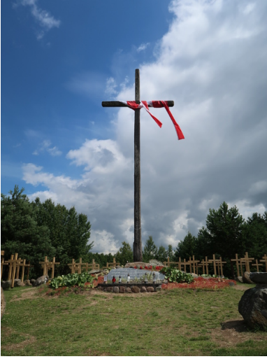
Pomnik w Gibach